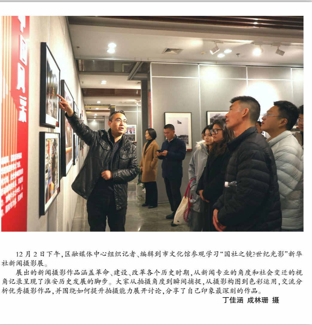
12月2日下午,区融媒体中心组织记者、编辑到市文化馆参观学习“国社之镜:世纪光影”新华社新闻摄影展。展出的新闻摄影作品涵盖革命、建设、改革各个历史时期,从新闻专业的角度和社会变迁的视角记录呈现了淮安历史发展的脚步。大家从拍摄角度到瞬间捕捉,从摄影构图到色彩运用,交流分析优秀摄影作品,并围绕如何提升拍摄能力展开讨论,分享了自己印象最深刻的作品。

从“线下”到“线上”赋能智慧便民服务。全区设置26个镇(街)营业网点提供开户、收费、咨询等线下服务,线上开通微信公众号,方便用户查询每月用水账单和缴费明细,开通支付宝、微信、农商行等线上缴费渠道,实现线上线下上的完美融合。通过智慧水务功能整合,将客服系统和“12345”便民热线反馈的各类供水问题,全部纳入工单化闭环销号管理,安排专人跟踪处置,直至问题彻底化解、销号办结。截至11月底,区农村供水公司水费收入已突破4000万元,水费回收率达98.36%,经济效益与社会效益取得双丰收;累计受理12345平台工单529件次,响应率、办结率、服务满意率均达100%。