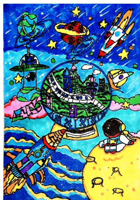
探秘太空 新安小学二(8)班 成鹿鸣 作