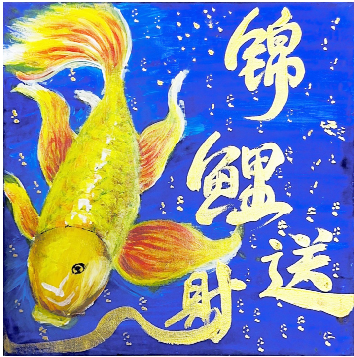
锦鲤送财 周恩来红军小学三(10)班 董谨祎 作