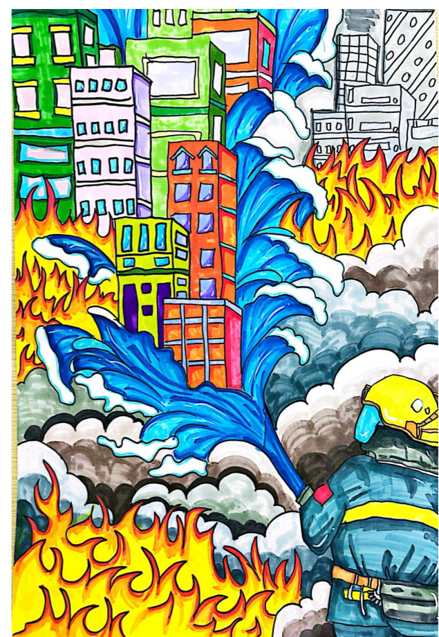
消防救援 新安小学河西分校一(1)班 钱宇萱 作