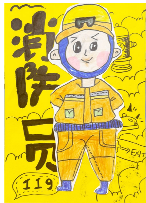
小小消防员 新安小学河西分校一(2)班 贺子乐 作