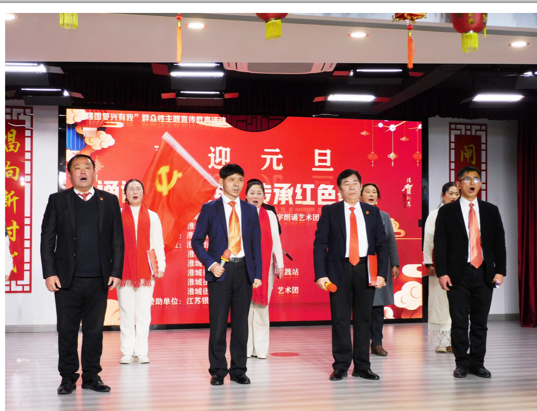
12月26日是毛泽东同志诞辰131周年纪念日。淮城街道闸口社区举行“诵读伟人经典 传承红色基因”诗歌朗诵会。村干部、社区工作者、文艺工作者深情朗诵了毛泽东的经典诗词,精彩纷呈展现了毛泽东诗词的意气风发和豪情壮志,让在场的观众深受感染。

此外,今年村里还投资5万多元,延伸铺设新建、泾北两个村民小组的污水管道,92户群众受益,为全村98户进行了标准化改造,进一步提升了人居环境。