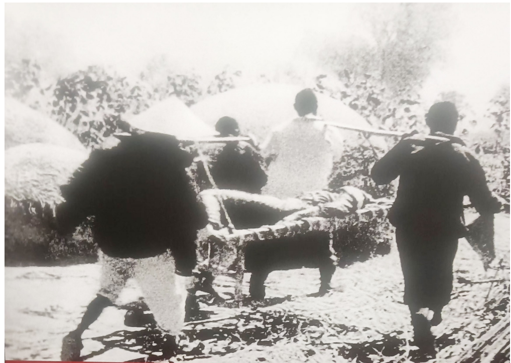
群众抬新四军伤病员

彭雪枫遗体刚刚安葬完,淮北各地老百姓在春节习俗上又加了一个内容,家家户户将彭雪枫遗像挂在堂屋正墙上,把贡桌放在遗像下,摆上祭品,作虔诚祭奠。可见老百姓是何等地敬重彭雪枫!