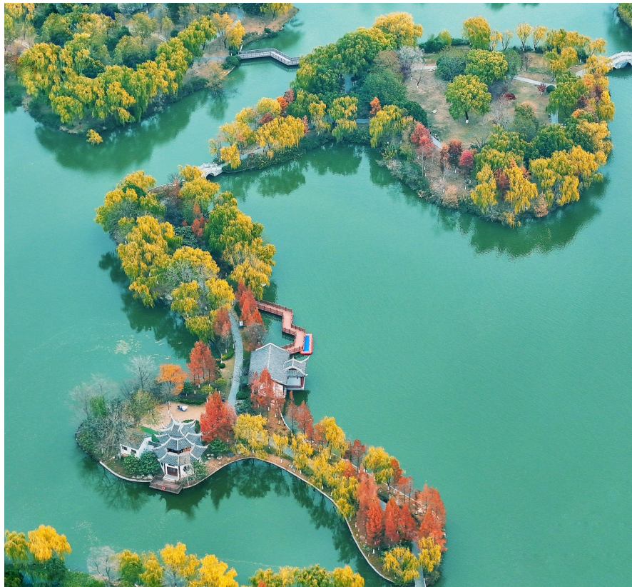
五彩斑斓萧湖园

从黄河入海口回来虽然已经有一个多月了,但我的脑海里还时常浮现那如雪覆盖的芦花、展翅飞翔的候鸟和黄蓝分明的大海。