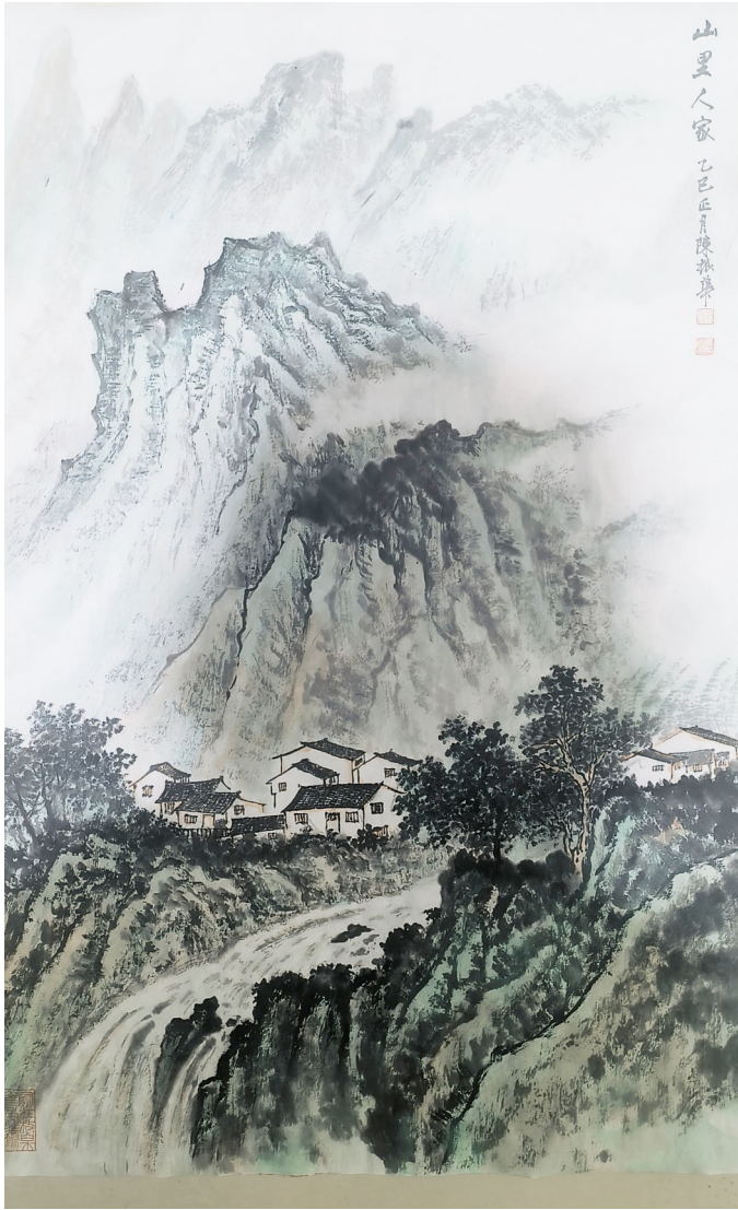
山里人家 陈振华 作