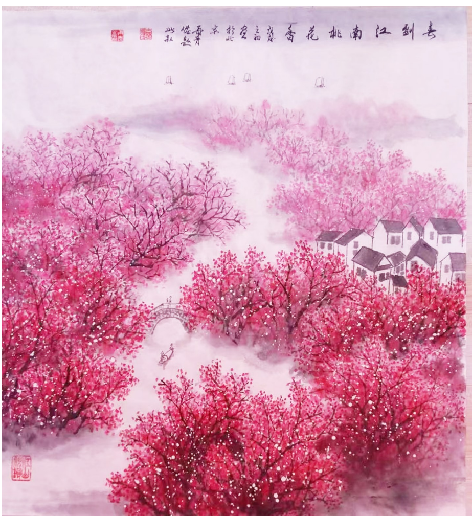
桃花源里 潘再青 作

春雷响,惊蛰始,仲春已悄然而至。沉睡的万物终于苏醒,这是草长莺飞的季节。春风中,那嫣红的桃花如羞涩的少女,粉嫩的杏花似俏皮的孩童,洁白的梨花若纯洁的仙子,共同织就了一幅绚丽多彩的画卷。一川烟雨,满城花事,惊蛰更是一个充满诗情画意的季节。