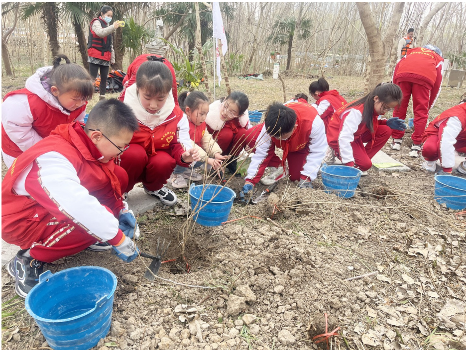
近日,淮安市楚州实验小学“植绿护绿”红领巾志愿者微服务队的少先队员代表和龙光阁幼儿园的小萌娃,来到萧湖景区松鼠岛,开展“我为萧湖穿绿衣”植树节主题活动。

从教学目标、教学内容、教学方法、教学效果等方面认真严谨地对参赛选手进行了综合评分,并对选手们扎实的教学功底和创新精神给予了充分肯定。 本次竞赛为参赛教师搭建了一个展示自我、切磋交流和相互学习的平台,有效促进了他们专业成长和教学水平提升,对推动全区高中物理教育教学高质量发展具有积极的意义。