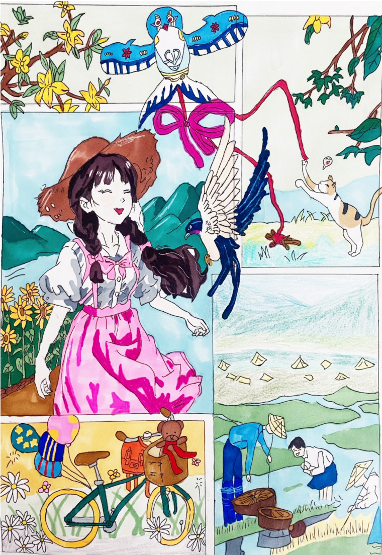
淮安市曙光双语实验学校六(9)班 陈晨 作 指导老师 卢 实