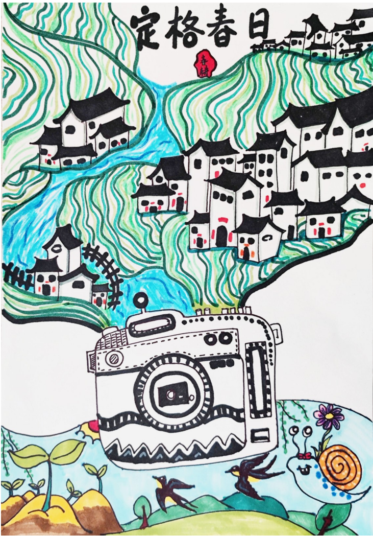
淮安市曙光双语实验学校六(1)班 纪宛妤 作 指导老师 杨爱娟