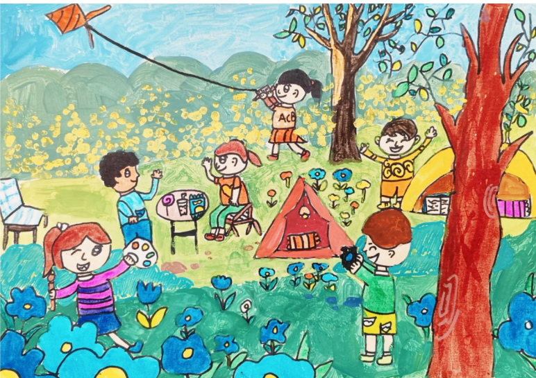
淮安市曙光双语实验学校一(6)班 陈莱染 作 指导老师 陈建云

己的绿。我知道,春天如约而至,而我怀揣着激动的心,匆忙赶赴与她的约会。童话里说,风是春天的魔法。于是,微风拂过,亲吻了寒冷花坛,抚摸了路边的小草,它们轻轻地舞动着细弱的身姿。淡淡的花香中裹挟着泥土的芬芳,弥漫在广场上,那是风的味道,让人陶醉于无边的春色。常言“春雨贵如油”。当春雨落下,便是春天给予大地的一个奇迹。它淅淅沥沥,像丝线、像牛毛、像珠帘……将飘散的冬天气息冲走。春雨过后,泥土和空气交织在一起,万物复苏,整个大地一片生机。春来了,她在小树林里、在小河边、在田野里,更在我们的心里。只要用心去感受,你就会发现春天的美无处不在!