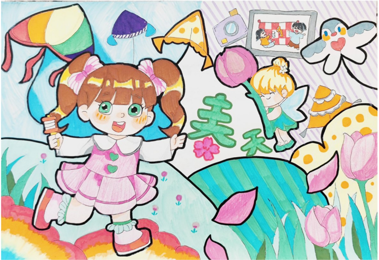
淮安市曙光双语实验学校六(1)班 顾 慧 作 指导老师 纪晶晶

编者按:四月的春风,带着暖意与生机,轻拂过淮安大地,也吹进了曙光双语学校孩子们的心间。在这个充满希望的季节里,孩子们以春天为笔,绘就了一幅幅绚丽多彩的画卷,用文字编织出一个个灵动鲜活的故事。他们用纯真的视角捕捉春天的每一个细节,用稚嫩的笔触描绘出春天的每一份美好。让我们一起走进孩子们的世界,感受春天的魅力,分享他们的快乐与梦想。愿这个春天,因为孩子们的创作而更加美丽,愿孩子们的童年,因为春天的到来而更加绚烂多彩。