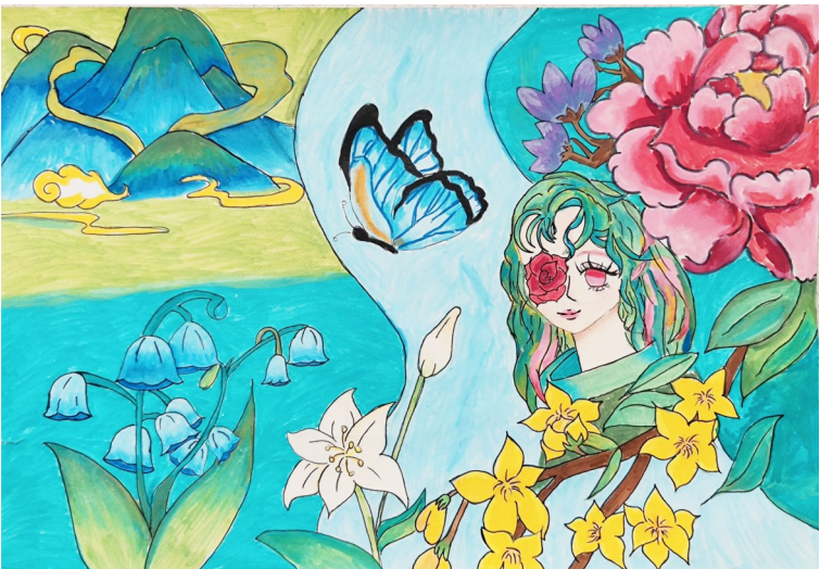
淮安市曙光双语实验学校六(1)班 李歆悦 作 指导老师 卢 果