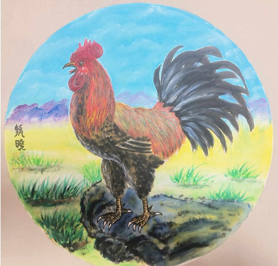
报 晓 赵寿金 作

冰冷的木鱼声陪伴着道貌岸然的刘二旦诉说着“虔诚”。刘二旦讲起佛经来头头是道。他说:“你知道佛祖为什么双手合十吗?收起来了,一切全都收起来了,把一切全放在了心上,放在了手里。”刘二旦又说:“人的苦恼,千言万语归结根底就是一句话‘放不下’,学会放下,是种美德;懂得坚持,方有始终。一个人放下了,就会无比轻松。” 谁都知道,人生在世“跳出三界外,不在五行中”是不可能的。“人、道、魔”三界只有一线之隔,成道、成魔,只是一念之差!有一天,我从刘二旦家门路过,见一