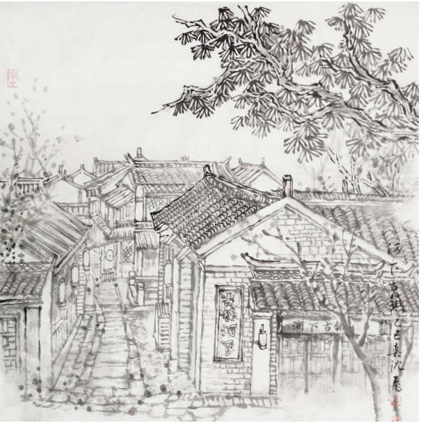
河下南入口 沈 飞 作