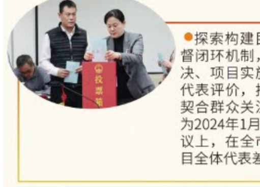
▶探索构建民生实事项目全流程监督闭环机制，确保项目选定代表票决、项目实施代表监督、项目成果代表评价，推动民生实事项目真正契合群众关注、满足群众需要。图为2024年1月，区十七届人大五次会议上，在全市率先开展民生实事项目全体代表差额票决。