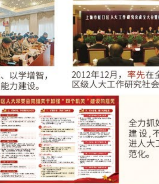
▶以学铸魂、以学增智，持续加强能力建设。2012年12月，率先在全市成立区级人大工作研究社会组织。

2016年1月，在全市率先在全区各街道设立工作委员会。近年来，深入贯彻落实《上海市区人民代表大会常务委员会街道工作委员会工作条例》要求，进一步加大对街道人大工作的指导力度，有力推动人大街道工委建设更加制度化、规范化、长效化，持续打造“一街一品、一居一特”品牌矩阵体系。