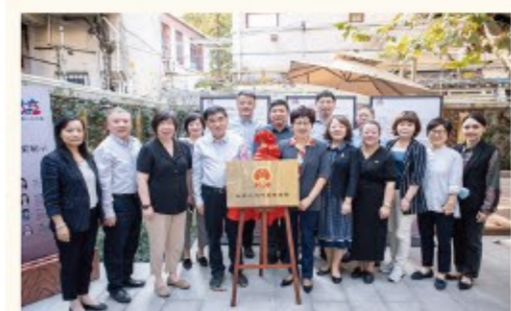
▶构建“8+14+198”的人大代表“家站点”网格化体系，做到街居、行业全覆盖。在此基础上，创设12个人大代表联络站，专业聚焦具体问题，丰富全过程人民民主基层实践。