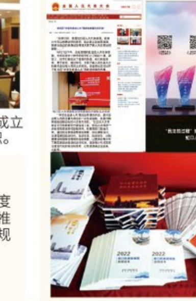
▶全力抓好制度建设，不断推进规范化。