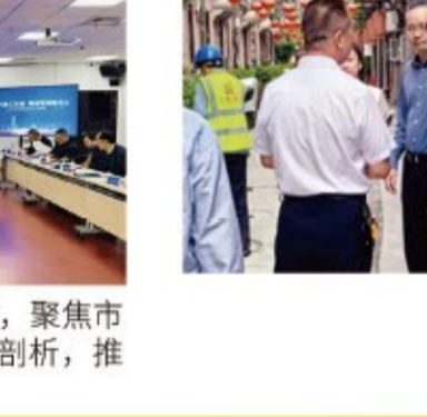
▶推动解决民生实事