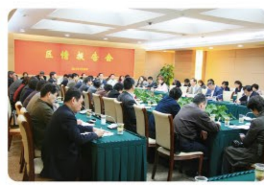
▶多年来，坚持区情报告会制度，有力保障代表知情权。

图区二届人大一次会议议案（提案）审查情况的报告和提案处理单。1984年3月，八届人大一次会议首次将人大代表提案区分为“议案”和“建议、批评和意见”。