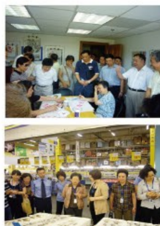
▶2011年，区人大常委会先后组织代表调研视察养老、食品安全等工作。