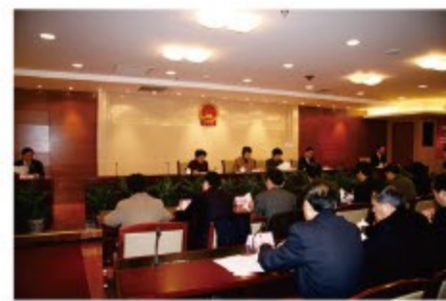
▶2004年，区十三届人大常委会第十六次会议通过《虹口区人大常委会关于本区历史文化风貌区和优秀历史建筑保护的决议》，出台前召开听证会听取群众意见，这在上海人大系统内属于首次。