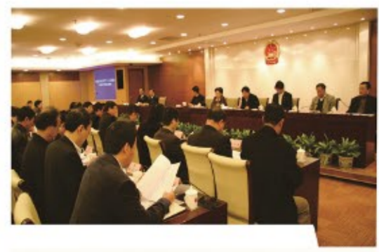
▶2008年12月，首次就五年规划执行情况开展专项监督。经过历届区人大的不懈努力，监督深度和广度不断走深走实。