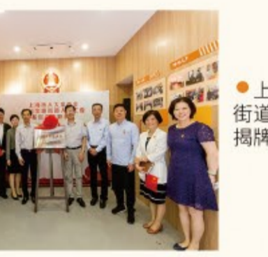
▶上海市人大常委会四川北路街道人大工委基层立法联系点揭牌成立。