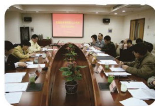
▶1992年起，建立区领导定期与区人大代表双向约见制度。图为2011年1月围绕养老服务工作开展双向约见。

新时代继续开承再续华章。党的十八大以来特别是本届人大以来，在市人大全面指导、区委坚强领导下，虹口人大践行和发展全过程人民民主重大理念，在推动依法履职上更加创新，在以人民为中心的实践上更加自觉，在坚持以解决问题为导向上更加主动，聚焦人民群众“办事难、办事慢、办事烦”问题，积极反映民意、处理民事、规划民安、落实民需，努力打造一批彰显制度优势、富有区域特色、人民可感可知的平台载体，不断丰富全过程人民民主的虹口实践，成为全力建设“上海北外滩、都市新标杆”，推进区域高质量发展的重要力量。