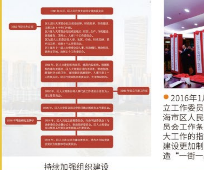
持续加强组织建设