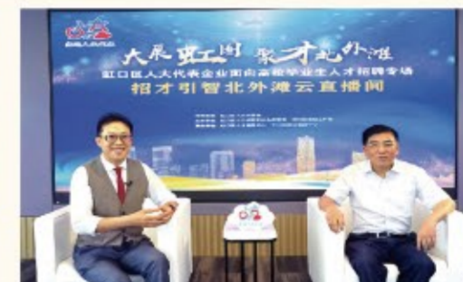
▶汇聚各方民意，借助网络力量，全市率先建设“直通人大代表”线上平台，搭建“代表领衔、人大搭台、部门联动、共治共享”工作格局，合力推动涉及群众切身利益的问题得到解决。