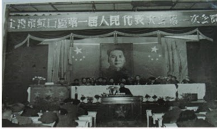
▶1979年7月，五届全国人大二次会议通过关于修改宪法的决议和新的地方组织法，规定县级以上地方人民代表大会设立常委会。1980年8月，区七届人大一次会议选举产生首届区人大常委会。