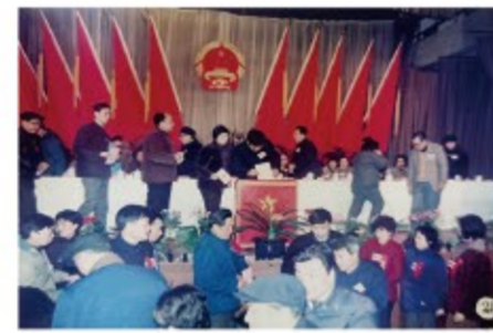
▶1987年5月，区九届人大一次会议上进行投票表决。