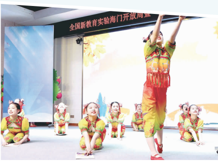
开发区小学“童声里的中国”

本报讯（记者施懿睿）昨日记者从海门气象台了解到，受高空槽东移影响，今天我区有一次雷阵雨天气过程，雨量中等、局部大雨。受阴雨天气影响，气温跳水，今天最高气温回落至22℃附近。市民朋友请根据自身情况，合理着装。本周二起，阴雨天气暂别，天气转好，以多云或阴的天气为主。