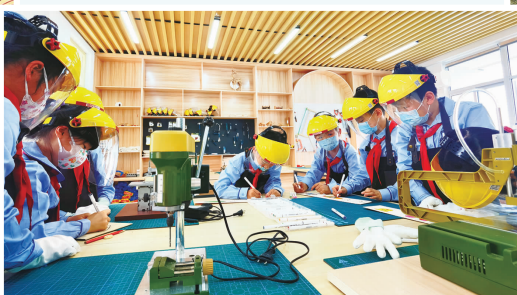
东洲小学长江路校区“双减”案例全省推广