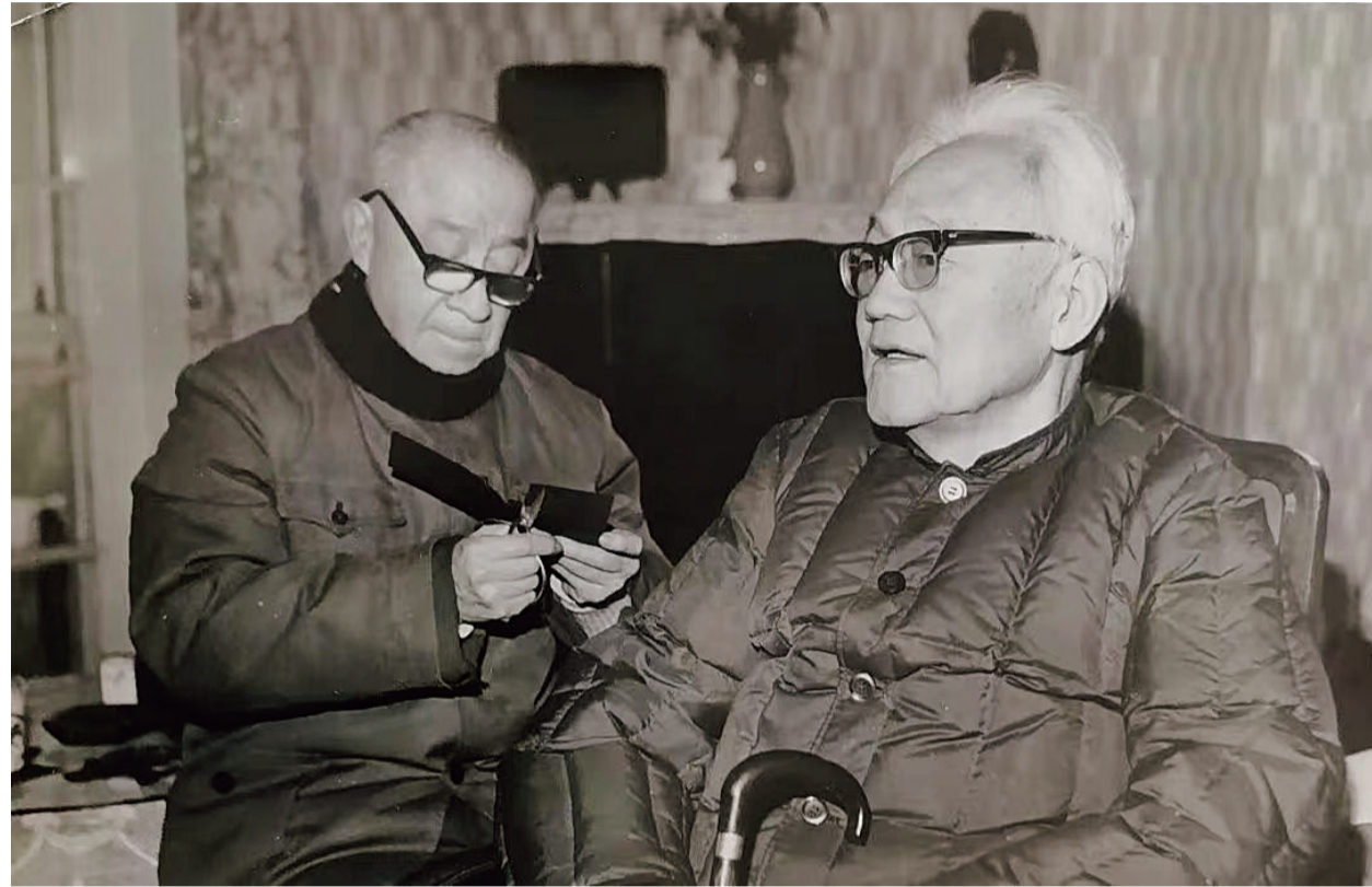
万籁鸣(左)为巴金剪影

万老除绘画之外,还喜剪影。他兴致甚浓地向我们介绍了他为巴金剪影的情景。一次,在武康路一幢花园楼房里,巴老坐在采光较好的窗口前,万老戴上玳瑁的老花眼镜剪开了。待到剪好后,很自然地把眼镜插回上衣口袋。这时,巴老接过剪影,戴上金丝边眼镜仔细地欣赏着,并不时地称赞着说:“老兄,老枝绽青,不愧为艺术大师,剪得真像。”边说边摘下眼镜,随手放在桌上。在座的也抢着欣赏这幅剪影头像,你一句,我一言,沉浸在欢