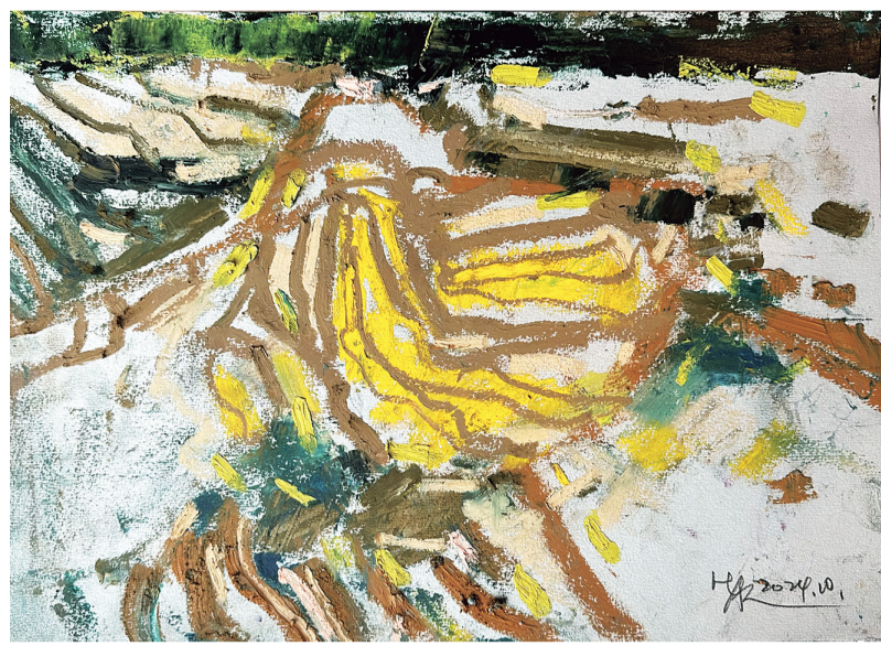
丽水云和·金灿梯田 (纸本油画) 黄阿忠

翠芽黄蕊挂枝头 木樨开冠三秋 桃李羞寒寒秋 花中素雅第一流 月照仙姿满院 风摇芬芳盈楼 诗书有赞传千古 任他九章故不收