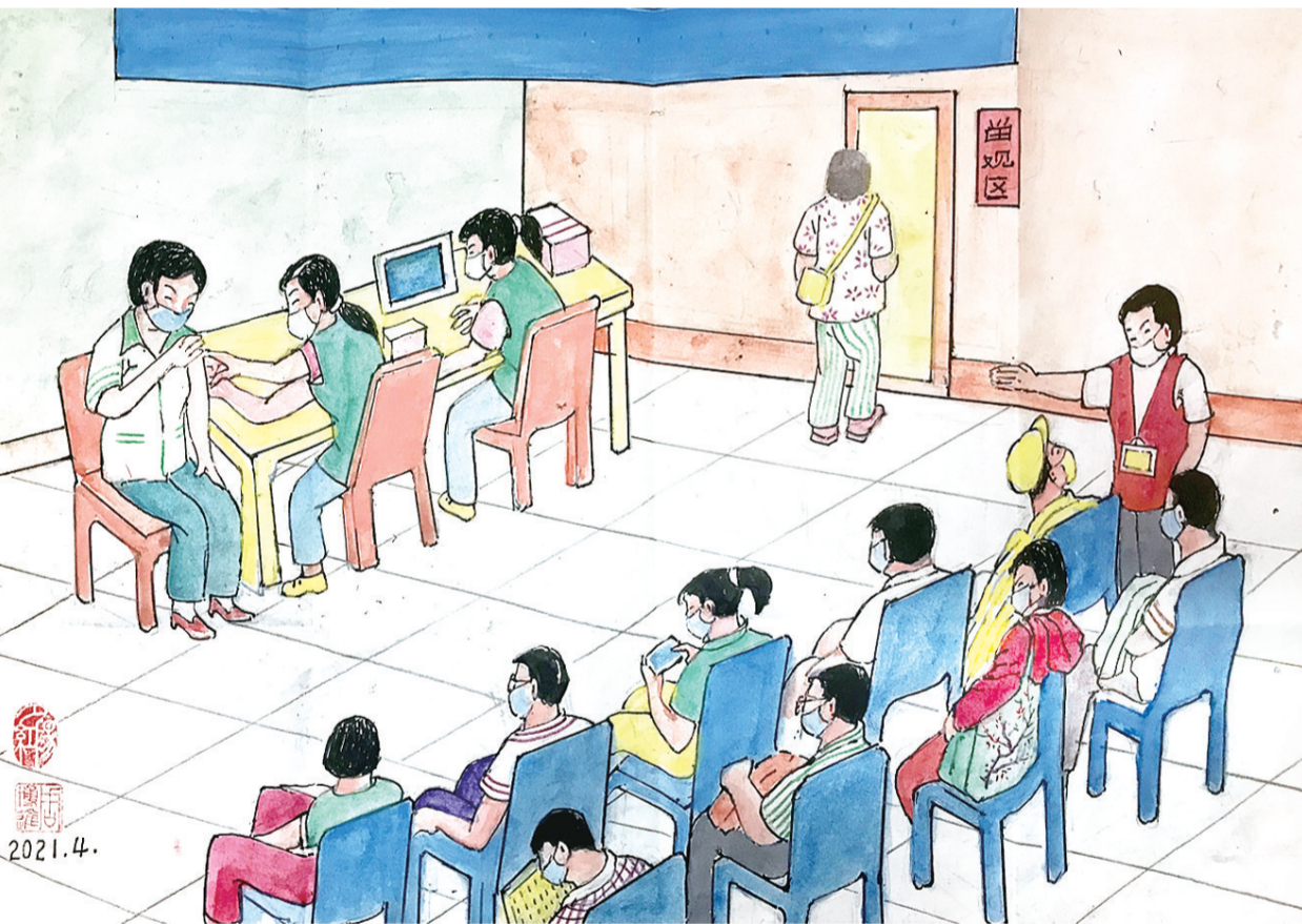
疫苗接种你我他 健康家园靠大家