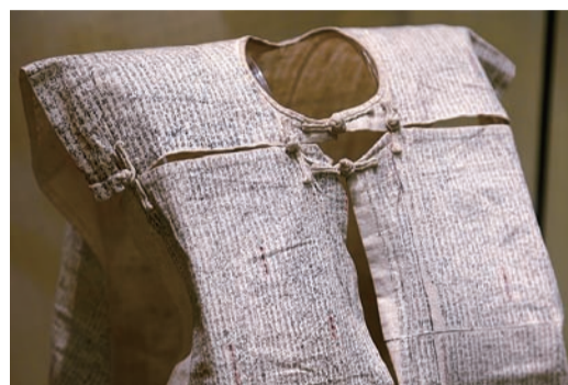
明伦堂内陈列的清代麻布质地的中式坎肩，上面共有62篇八股文，总计4万多字。