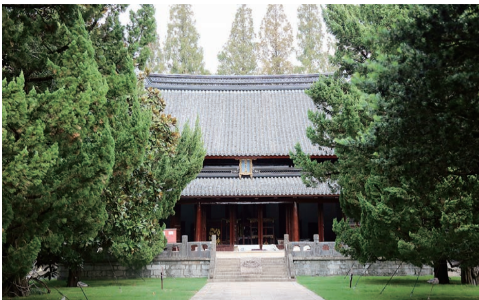
大成殿作为孔庙的核心建筑，不仅有孔子形象及其生平事迹的展示，还保留了祈福活动区，可为市民游客提供许愿祈福的文化体验。