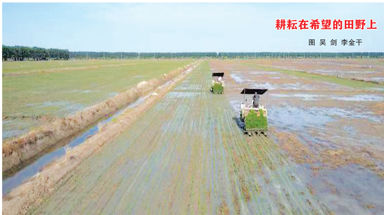
耕耘在希望的田野上