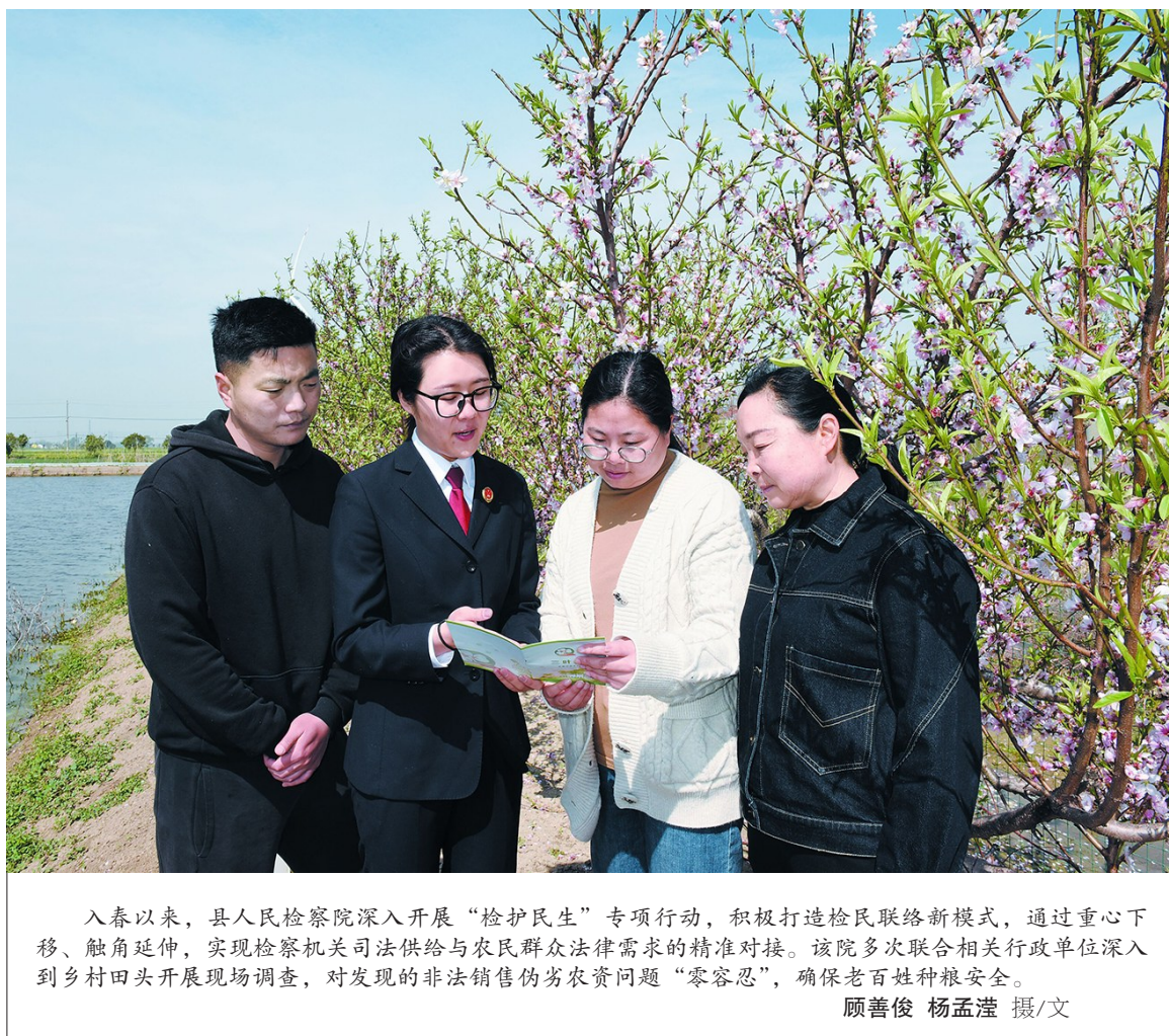
入春以来,县人民检察院深入开展“检护民生”专项行动,积极打造检民联络新模式,通过重心下移、触角延伸,实现检察机关司法供给与农民群众法律需求的精准对接。该院多次联合相关行政单位深入到乡村田间地头开展现场调查,对发现的非法销售伪劣农资问题“零容忍”,确保老百姓种粮安全。