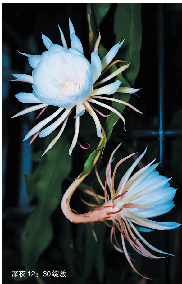
深夜 12:30 绽放