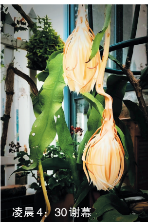
凌晨 4:30 谢幕