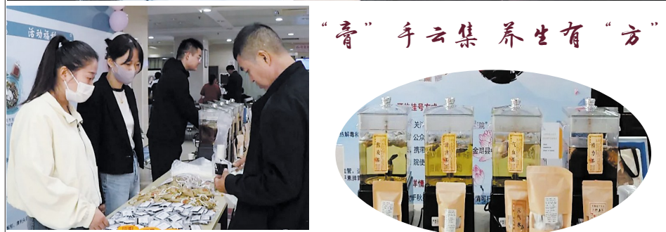
27日，县中医院举办第九届“膏方节”，许多市民带着自己的病历资料前来排队问诊，专家们根据市民的疾病特性和体质差异，把脉、问诊、开方。“膏方节”已经成为县中医院的特色和名片。