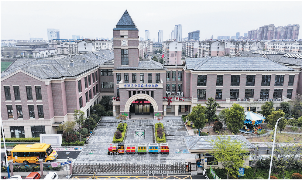
中芬森林幼儿园全景图

全年“零事故”的背后，是晨午检的细致、消防演练的严谨；98%的健康达标率，源于科学膳食搭配与医教联动。幼儿园以全方位的守护，为童年撑起一方晴空。 回顾来时路，感恩每一步坚实的足迹；展望新征程，期待与您继续携手，以自然为书，以爱心为笔，为孩子们书写更绚烂的成长篇章！ (孙达萍 陈义宝 何学宇)