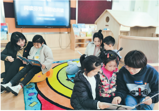
关爱留守儿童，与孩子共读一本书