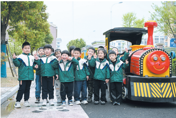
倍受青睐的动力小火车