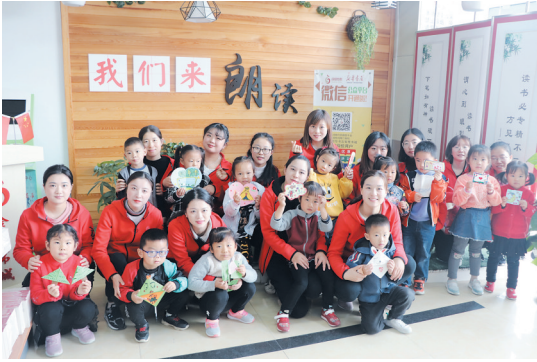
“四叶草”守护团联合新华书店开展主题活动