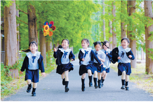
滨湖幼儿园：毕业旅行