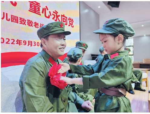
烈士纪念日邀请老兵进园讲英雄故事