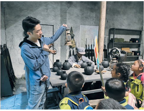
带领孩子们走进红色基地