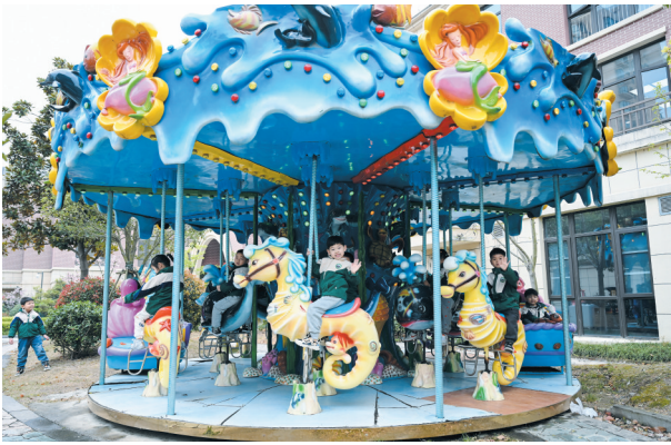
旋转木马上的开心一刻