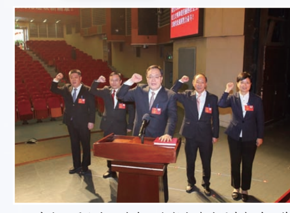
市十八届人大一次会议上新当选的国家机关工作人员向宪法宣誓。

市人大及其常委会始终坚持党管干部与依法选举任免相结合,保证党组织推荐的人选通过法定程序成为国家政权机关的领导人员。严格执行对拟任命人员任前法律知识考试、任前承诺发言、颁发任命书、宪法宣誓、任期内述职评议等制度,强化任命人员依法履职意识。