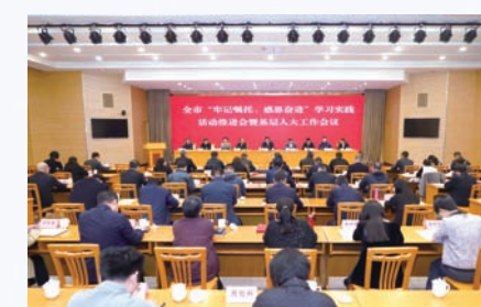
市人大常委会召开全市人大“牢记嘱托、感恩奋进”学习实践活动推进会暨基层人大工作会议。

市人大及其常委会始终坚持以政治建设为统领,全面加强人大机关思想、组织、作风、制度和干部队伍建设,努力成为自觉坚持中国共产党领导的政治机关、保证人民当家作主的国家权力机关、全面担负宪法法律赋予的各项职责的工作机关、始终同人民群众保持密切联系的代表机关,着力打造政治坚定、服务人民、尊崇法治、发扬民主、勤勉尽责的人大工作队伍。