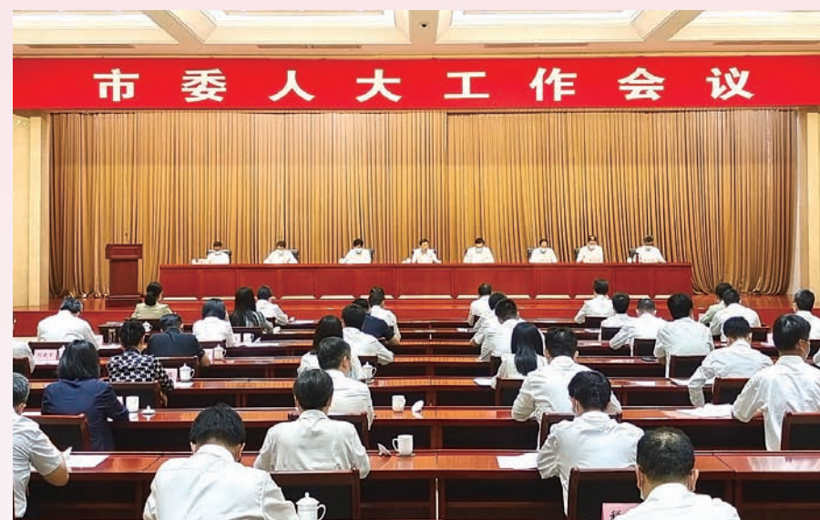
2022年6月10日,江阴召开市委人大工作会议,无锡市委常委、江阴市委书记许峰出席会议并讲话。

市人大及其常委会始终坚持党的全面领导这一最高政治原则,切实把党的领导贯穿人大工作各方面全过程,保证人大工作始终保持正确的政治方向,切实做到了党的工作重心在哪里,人大工作就跟进到哪里,力量就汇聚到哪里,作用就发挥到哪里。