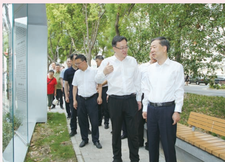
市委书记许峰调研人大工作。