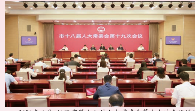
2024年6月,江阴市第十八届人大常委会第十九次会议通过《关于加强国有资产监督管理情况的决定》。