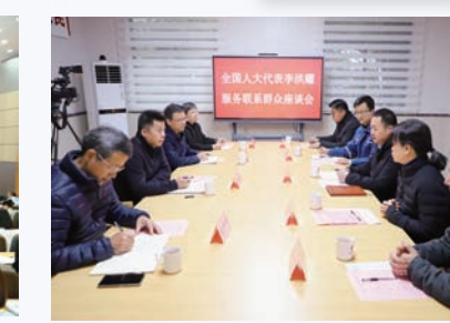
人大代表常态化联系服务群众。