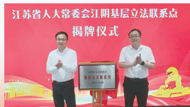
2024年5月10日,江苏省人大常委会江阴基层立法联系点在江阴市人大代表之家设立揭牌。