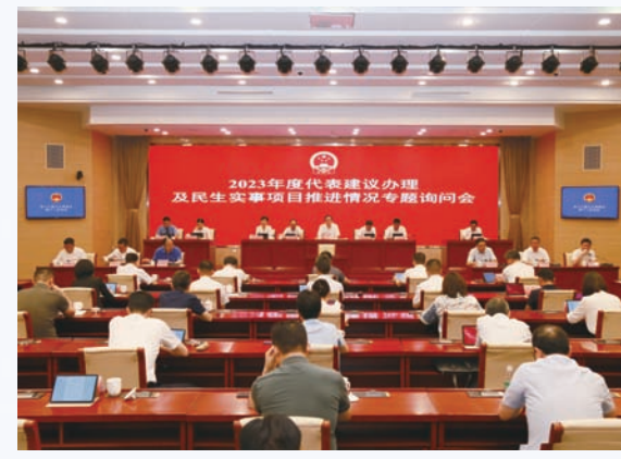
2023年8月,市十八届人大常委会开展代表建议办理和民生实事项目推进情况专题询问会。