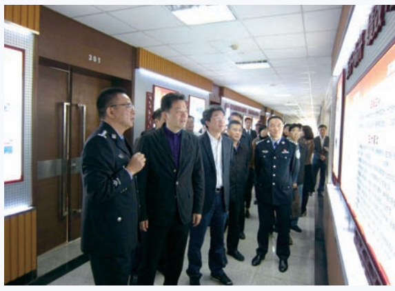
2017年11月,市十七届人大常委会主任孙小虎带队视察公安工作。