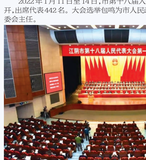
2022年1月11日至14日,市第十八届人民代表大会第一次会议召开,出席代表442名。大会选举包鸣为市人民政府市长,计军为市人大常委会主任。