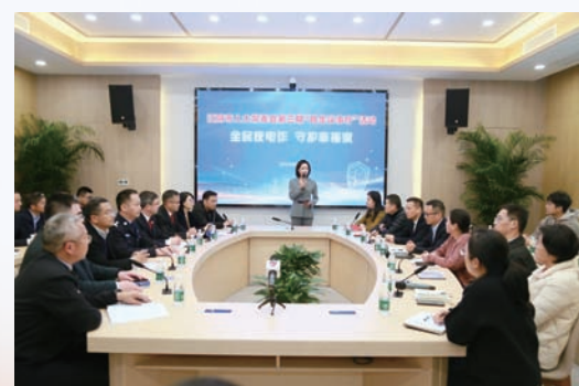
市人大常委会聚焦“全民反诈”举行“民生议事厅”。