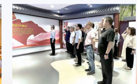
市人大常委会开展“5·10思廉日”暨“铁纪在心 廉洁修身”主题党日活活动。