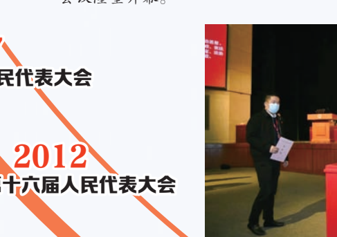
市十八届人大全面实行民生实事项目人大代表票决制。