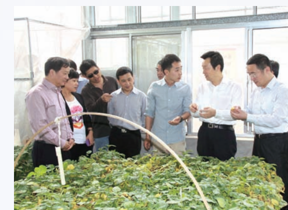
2014年5月,市十六届人大常委会主任赵国权带队视察现代农业示范园区建设情况。