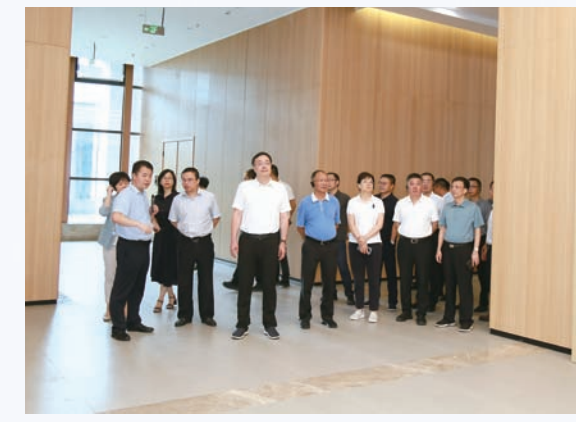
2024年8月,市十八届人大常委会主任许军带队视察南京大学江阴霞湾校区。