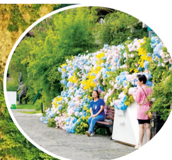
日前,园博园取消入园大门票,实行开放式运营,并上新众多新玩法、新产品。