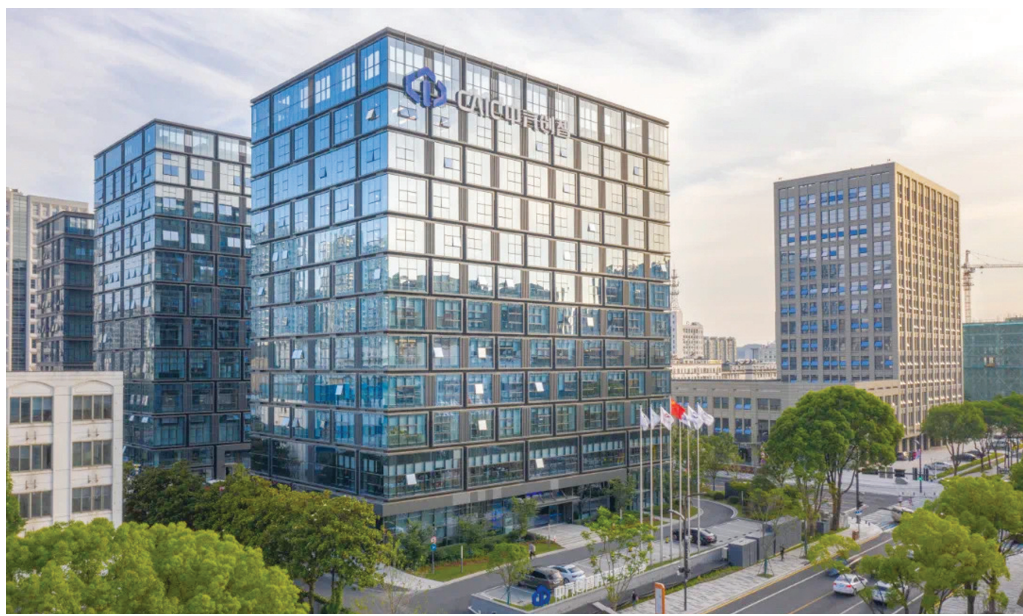
9月10日,中汽创智旗下首个产业化项目公司——中汽创安(南京)科技有限公司在江宁开发区运营,为汽车信息安全领域注入了强劲创新动能。

上个月,江宁开发区与国家电网南瑞集团签订共创“双千亿”合作协议,以智能电网这一国家级先进制造业集群为龙头,江宁正着力打造4个两千亿级创新型产业集群。(下转三版)