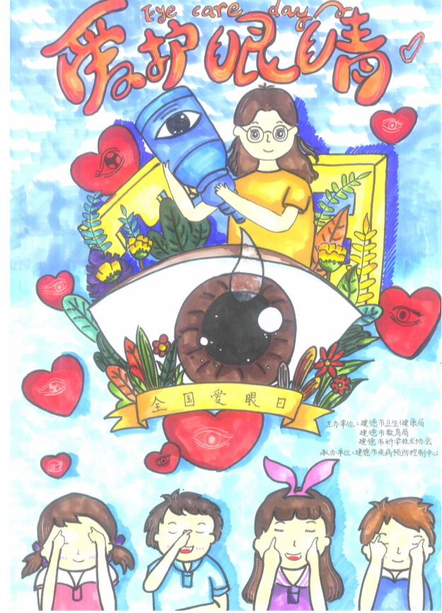
爱护眼睛 梅城中心小学 602 班 余灏茹