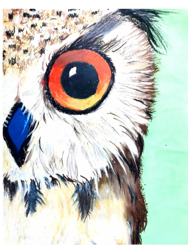
鹰眼 洋安中心学校 502 班 郑卿悦