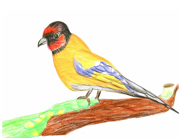
枝头小鸟 新一小四 (4) 班 邹瑜