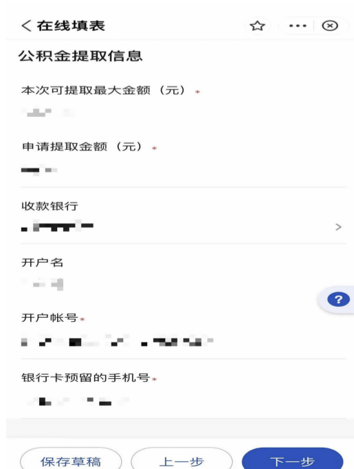
⑧按实际情况填写提取金额、收款银行、银行卡号等信息