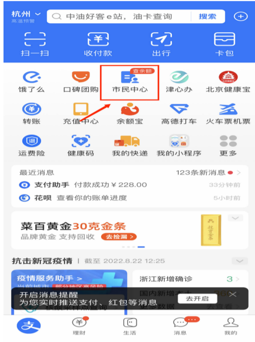
①打开“支付宝”,首页点击“市民中心”

最近,公积金无房租赁提取的界面更新啦,今天我们就来学习最新的网上操作流程吧。如有疑问,也可以拨打电话0571-64780121,咨询公积金提取业务。