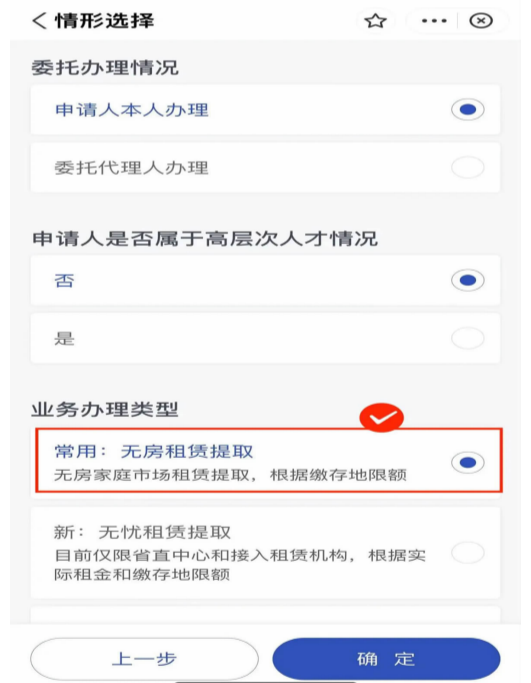
⑥“情形选择”按实际情况填写,“业务办理类型”选择“常用:无房租赁提取”