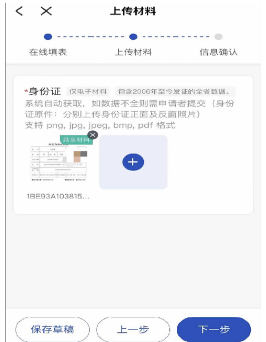
⑨上传需要补充的材料,确认信息无误后提交申请