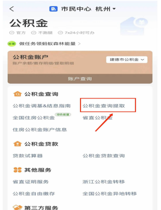
③选择“公积金查询提取”