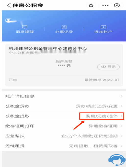
④跳转页面后选择“公积金提取”