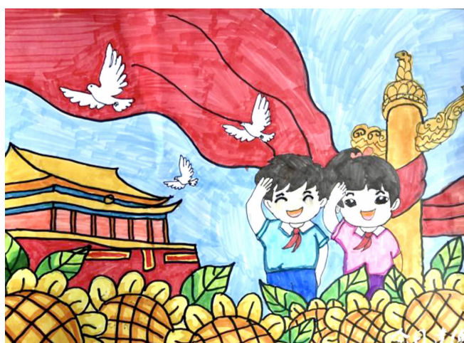
向红领巾致敬 大洋中心小学三(2)班 张珂可 指导老师 黄倩雯