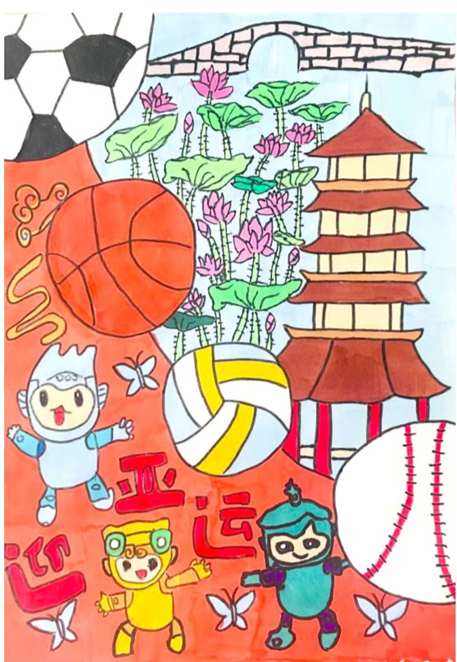
迎亚运 大同一小 林政汐