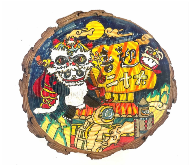
喜迎二十大 一起向未来 梅城南峰小学 601 班 吴晓晓 指导老师 王咪静