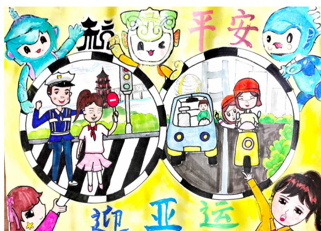
平安迎亚运 新三小 502 班 朱若兮