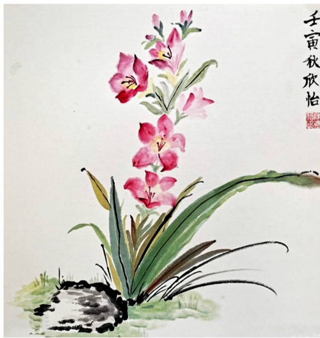
水墨菖蒲 寿昌一小 502 班 陈欣怡 指导老师 何建芬