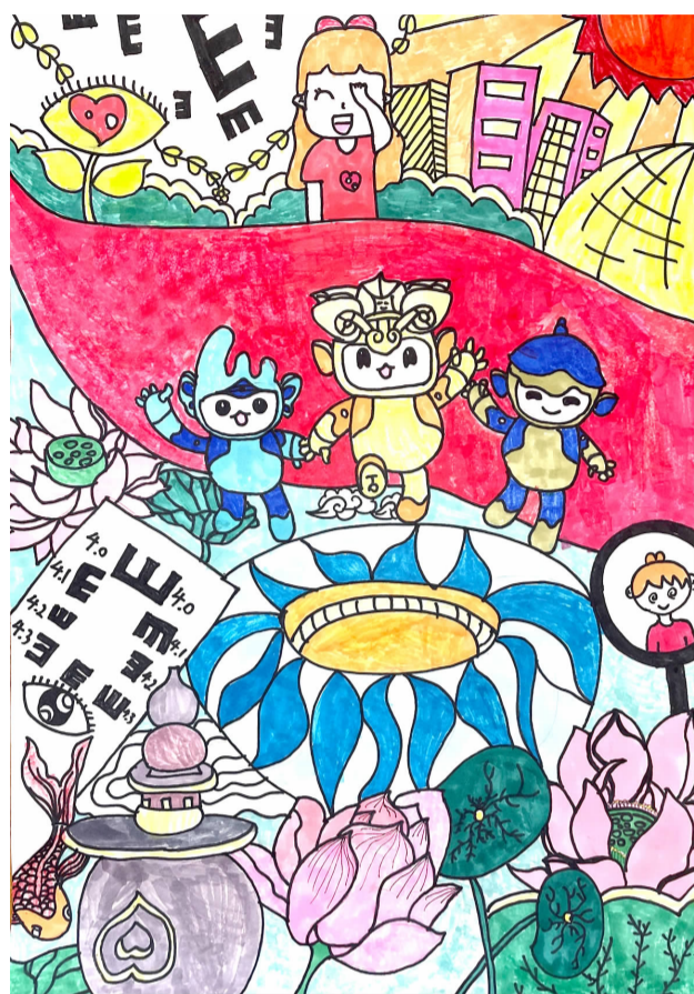
爱眼护眼 喜迎亚运 梅城南峰小学 601 班 马苗 指导老师 王咪静