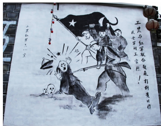
中央红军在黄平画的漫画