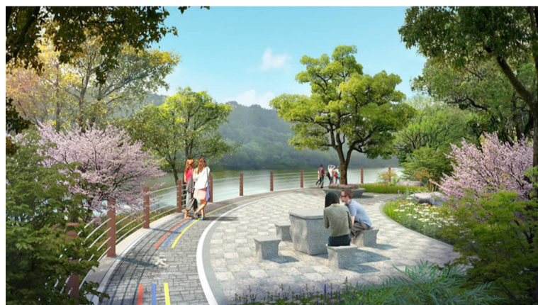
休息停靠点效果图

新安绿道胥溪北段的路线主要沿胥溪北侧山体等高线铺设，绿道一般高程为 26 米。其中，建强玫瑰园山庄、胜奇山庄段分别利用现状山庄游步道，现状山庄游步道宽度 1.5—2 米，可作为本绿道工程的一部分，利用现状山庄游步道总长度 560 米，本次新建绿道长度 2946 米，其中新建栈桥长度 450 米。此外，在桩号 K0+400 处胥溪有一现状江心岛，在江心岛处新建一座休憩亭，并从就近绿道新建桥梁引入。