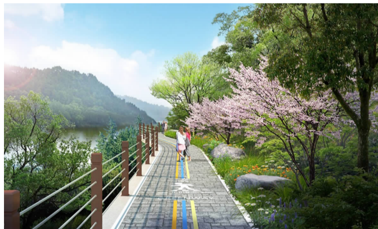
新安绿道胥溪北段效果图

该绿道致力打造成一条“低碳步行之路”，项目分水岸风光段和山野探险段两部分，分别勾勒出自然之脉搏和绿色之趣行两大功能区，在满足绿道功能性的同时，力求体现人、路、自然的和谐，在设计上最大限度地保护自然环境，将其沿线的自然和乡土人情，通过合理透景、障景、借景、框景、漏景等景观设计手法，浓缩为一幅幅完美的画面，展现于漫步者眼前。