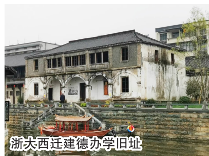
浙大西迁建德办学旧址