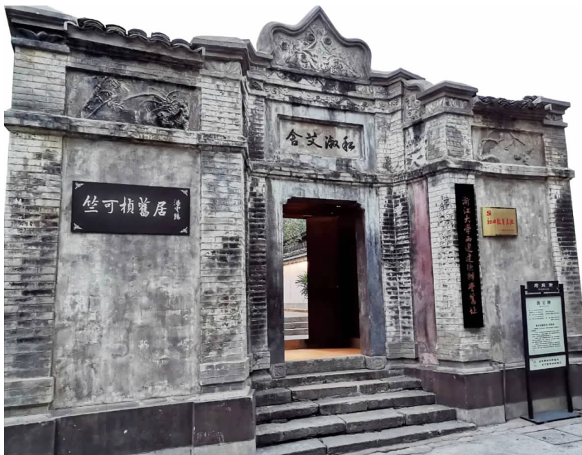
浙大西迁建德教务处办公旧址

1937年，日本发动全面侵华战争，战火弥漫中华半壁河山。国立浙江大学师生竺可桢校长率领下，怀着“教育救国，科学兴邦”理想，踏上漫漫西迁路，谱写了一部空前而伟大的“文军长征”史。而梅城正是这次历史上著名的“浙大西迁”的首站。