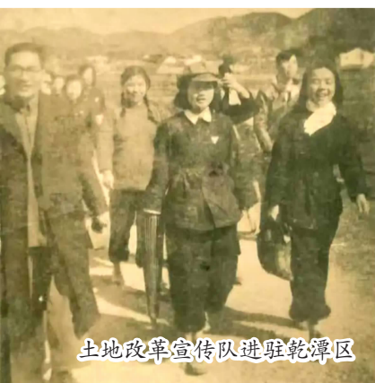
土地改革宣传队进驻乾潭区