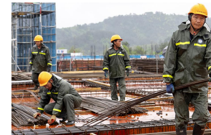
“五一”假期，在天目未来谷生态研学城工程总承包(EPC)项目施工现场，一片忙碌的施工景象。600余名建设者坚守在各自工作岗位，抢抓时间施工，确保工程进度。

记者了解到，此次拍摄分为室内、户外两部分，总拍摄时长约为36小时。其中，室内场景为大笑嗨剧场，户外主要在临安博物馆、板桥镇上田村、青山湖等地取景。“节目将以喜剧剧场为牵引，结合短剧，把临安的吴越文化、人文风景、乡村共富做一个呈现。”刘涛滔表示，节目预计5月底播出，大笑嗨剧场选送了6个本土节目，以及新临安人王贺俊、青年越剧演员徐云丹将会在节目中亮相。