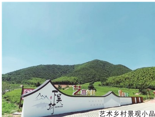
艺术乡村景观小品

“皖南星7天”意指到皖南度星期天,宣城所辖7个县市区,如同北斗七星一样串点成线,形成闪闪发光的艺术乡村风景线。