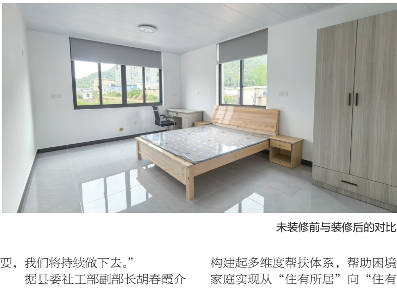
未装修前与装修后的对比