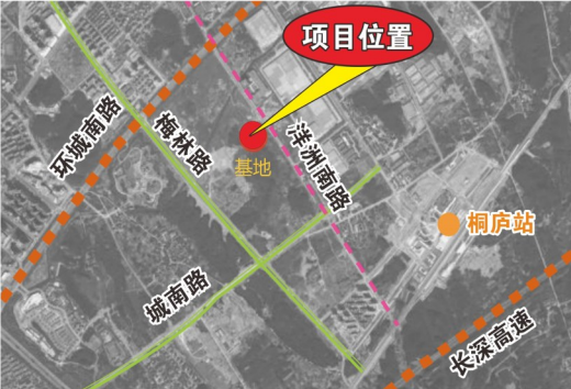
建设项目位置示意图