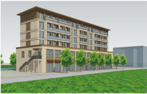
建设项目的鸟瞰图