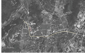
建设项目位置示意图