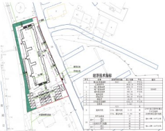
建设项目总平面图