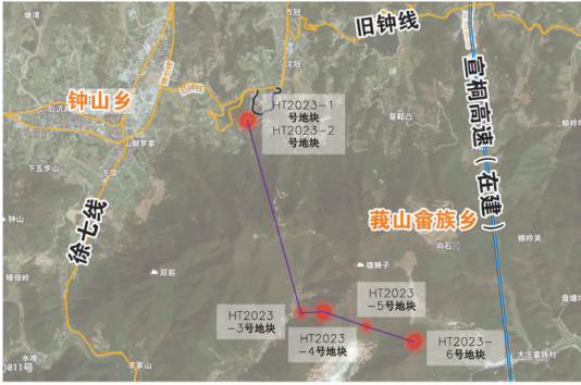
建设项目位置示意图