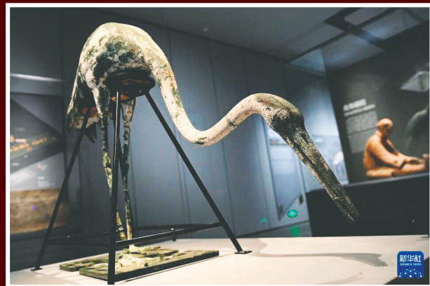
秦始皇帝博物院展出的青铜鹤。