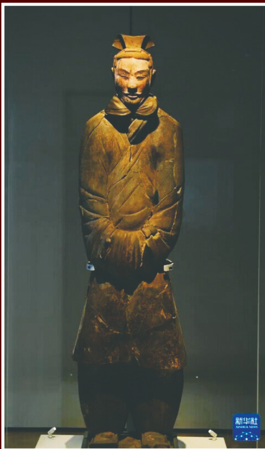
秦始皇帝博物院展出的袖手俑。