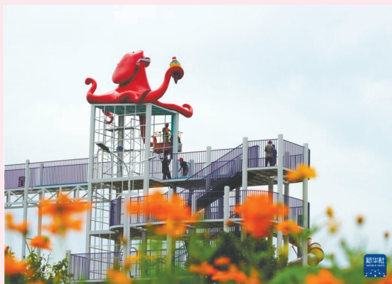
9月15日,工人在浙江省乐清市一游乐园建设现场施工。