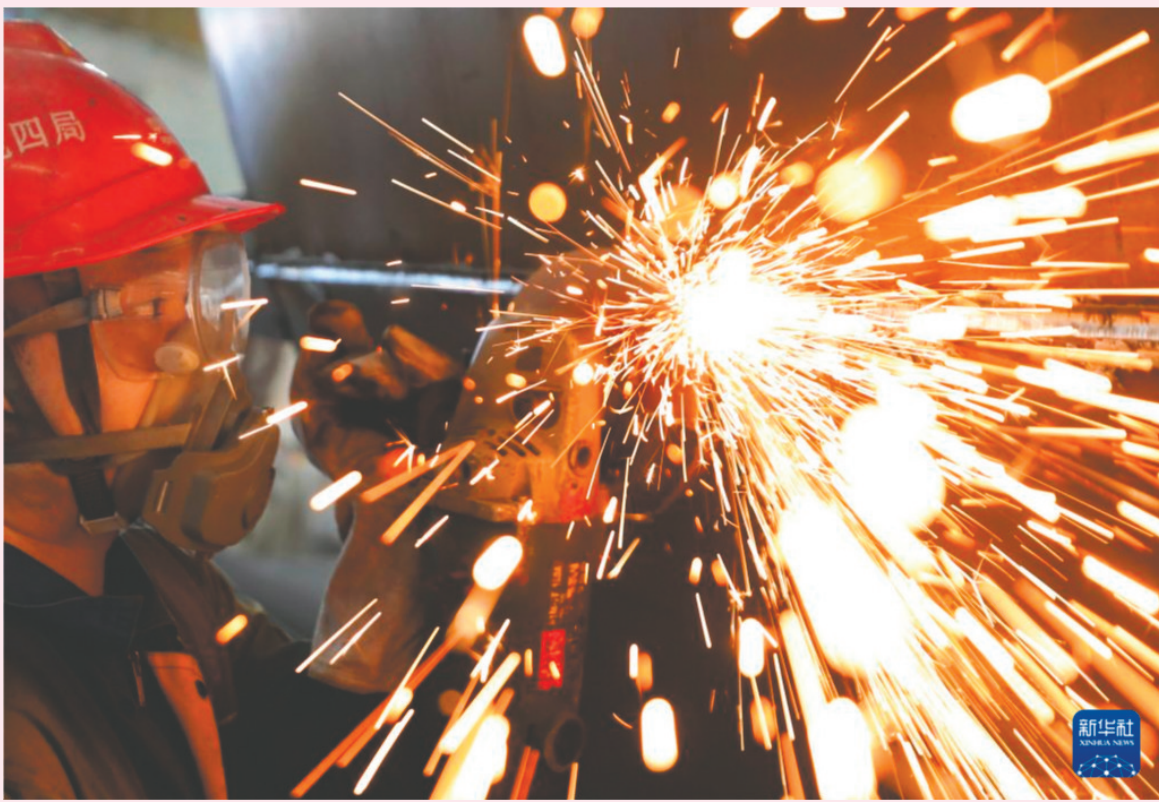
9月16日,在湖南省衡山县高新技术产业开发区,恒岳重钢钢结构工程有限公司员工在进行风电塔筒装备的打磨作业。