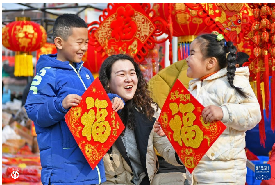
蛇年新春将至,人们选购各色年货,在浓浓年味中喜迎新春。

① 1月22日,在山东省烟台市福山区臧家庄镇北桥大集,家长和孩子们在选购春节饰品。