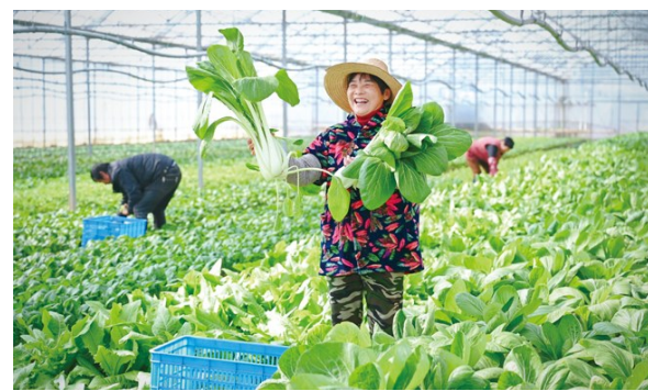
日前,在金华市婺城区琅琊镇暖田农业有限公司的连片蔬菜大棚里,工人正忙着收割当季蔬菜。经过整理、打包,这些蔬菜当天下午就能送到客户手中。随着春节临近,时令绿色蔬菜成了抢手货,本地种植的高脚白菜、青菜、茼蒿、芹菜、萝卜等应季蔬菜大量上市,满足人们的节日需求。