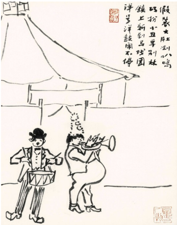
镇上新到马戏团(叶浅予)

此画也是那些年桐庐城乡节假日和庙会活动时常见的场景。 画面反映的是戏猴人的工作状态。当然这些戏猴人都是游走四方的外地人。为博人眼球,多得一点赏钱,戏猴人不惜转变角色,甘愿被猴戏耍。叶浅予用此画和一诗给予友善的讥讽: 新潮事事求革新, 猴儿打滚已失灵。 当年只知人戏猴, 而今时兴猴戏人。 画面上无论人还是猴的形象,都生动有趣,足见“浅予速写”的功力。 如今戏猴这样的场景,在桐庐乃至我国东部沿海地区,已经绝迹。 这幅“浅予速写”(《镇上新到马戏团》)反映的又是20世纪