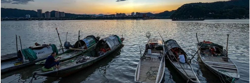
文字、图片 董利荣《叶浅予〈富春人物画谱〉解读》 叶浅予艺术馆

画上除两枚印章外,并无文字。同样配诗一首: 一网一网又一网, 浑水捞鱼在港湾。 农家最乐洪水期, 江岸处处拉吊网。 桐庐境内有两条江——富春江和分水江,夏季常常发大水。“大河涨水小河满”,大水期间,富春江、分水江及大小溪流水满堤岸,江边溪旁的农家常常在水边拉吊网网鱼,以此改善伙食。