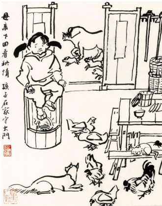
孩子在家守大门(叶浅予)

此画反映的是一群老太太外出旅游、结队进香的场景。 画面上,一尊高大的弥勒佛像,端坐在莲花基座上。一队中老年妇女,身背挎包排队前行,打头的那位举着旗子做引导。 画上题有四言小诗,很有意思,表明她们结队进香并不完全是因为崇拜菩萨,在一定程度上也是对“有福自享”的老伴的“抗议”: 退休老汉,有福自享。 我朝名山,结队进香。 改革开放初期,我国的旅游业刚刚兴起,老年人结队进香,从某种程度上来说也推动了旅游事业的发展。 叶浅予以此“浅予速写”,表现的是家乡出现的新事物。 此画可以说全由线条勾描而成,在群像画谱作品中,较为罕见。 如今的桐庐旅游市场,将美景、美食、民宿等多种独特体验集成推动,这个春天,更是创新推出了“春游桐庐·时光正好”春季文旅品牌,通过“文化+生态+消费”多维联动,为广大游客“解锁”桐庐春季旅游新“图景”。 “上春山、赏春花、戏春水、行春路、品春鲜、逛春市、卧春居”七大主题场景N种玩法,等你来桐庐好好嬉!