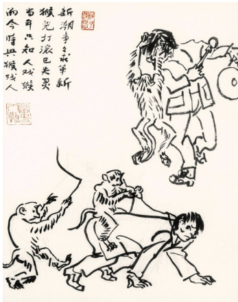
而今时兴猴戏人(叶浅予)

此画也是那些年桐庐城乡节假日和庙会活动时常见的场景。 画面反映的是戏猴人的工作状态。当然这些戏猴人都是游走四方的外地人。为博人眼球,多得一点赏钱,戏猴人不惜转变角色,甘愿被猴戏耍。叶浅予用此画和一诗给予友善的讥讽: 新潮事事求革新, 猴儿打滚已失灵。 当年只知人戏猴, 而今时兴猴戏人。 画面上无论人还是猴的形象,都生动有趣,足见“浅予速写”的功力。 如今戏猴这样的场景,在桐庐乃至我国东部沿海地区,已经绝迹。 这幅“浅予速写”(《镇上新到马戏团》)反映的又是20世纪