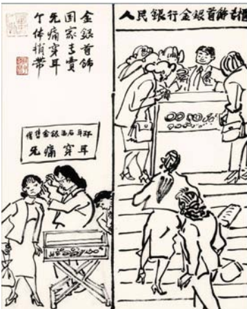
金银首饰 国家专卖(叶浅予)