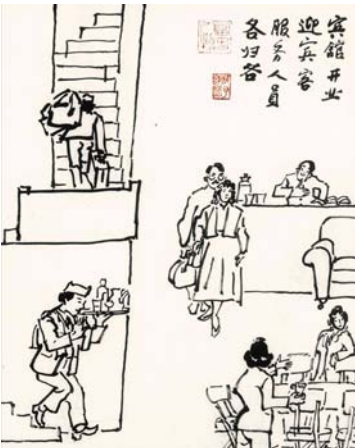
宾馆开业迎宾客(叶浅予)

20世纪80年代，宾馆开业也算是稀罕事，这幅“浅予速写”（《宾馆开业迎宾客》），描绘的便是当年桐庐县城宾馆开业的场景。作品反映了改革开放初期，从传统旅社到新式宾馆的变化，说明经济社会有了初步的发展。