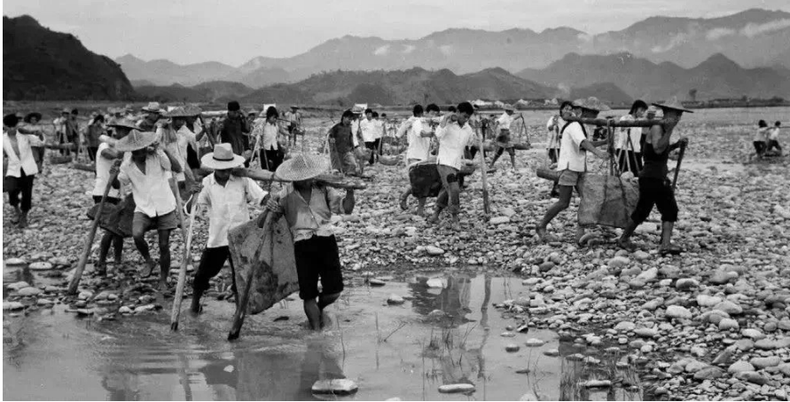
战天斗地建设家园

1998年12月，桐庐县委县政府决定修建分水江水利枢纽工程。自2005年5月28日下闸蓄水以来，桐庐境内已杜绝了特大较大洪灾的发生。