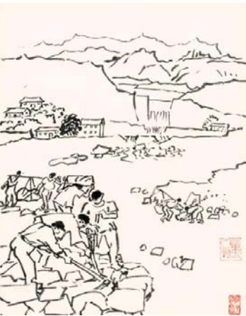
山民豪气冲霄汉(叶浅予)