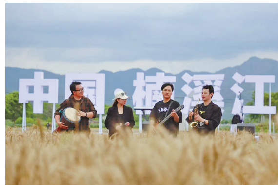
瓯村的音乐疗愈会