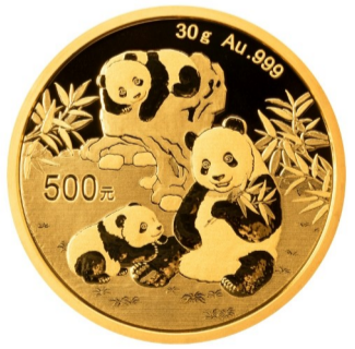
30克圆形普制金质纪念币背面图案