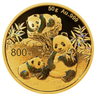
50克圆形精制金质纪念币背面图案