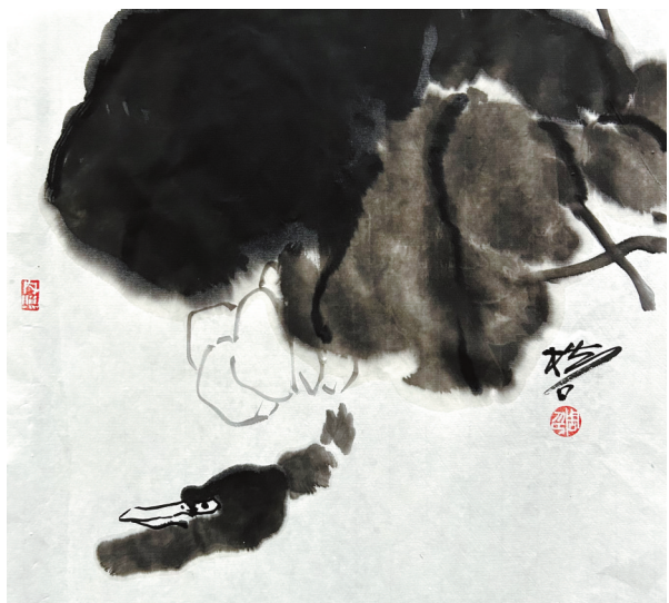
《华严水库一角》周松青