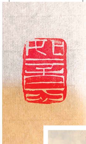
大明华严石篆刻作品：如意

元旦期间，天朗气清，朔风解意，一群砚文化爱好者相约瓯北华严山，策杖探幽，舒啸山林。一路上访华严寺遗址，寻华严彩石，探砚石古矿洞，不亦乐乎。乘兴而来，兴尽而返，众人颂歌华严，或赋诗、或书画、或篆刻，萃为一集，名为华严笔会，以飨读者。