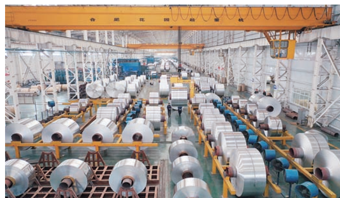
长山镇坚持以经济建设为中心,加快构建新发展格局。