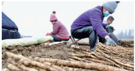
山药种植户正在收获山药栽子。长山镇大力发展特色农业种植,努力把“长山药”品牌做大做强,为乡村振兴奠定坚实的产业基础。