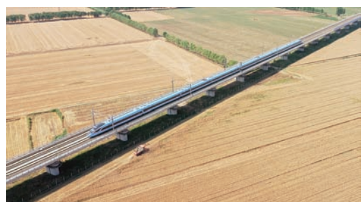
小麦喜获丰收。联合收割机穿梭在金色的麦田中,与奔驰的高铁擦身而过。