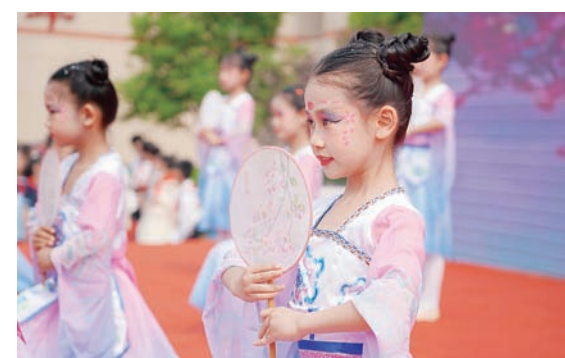
范公小学的孩子们用精彩纷呈的文艺节目欢庆“六一”儿童节。