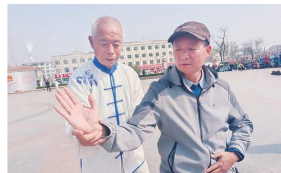
开展太极拳培训等各类特色文化活动,提升公共文化服务效能,丰富群众的精神文化生活。