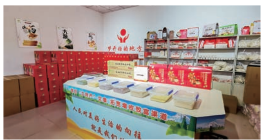
长山镇东南村依托惠群农业专业合作社,打造集“共富农场”“共富工厂”“共富市场”于一体的“共富项目”综合体。