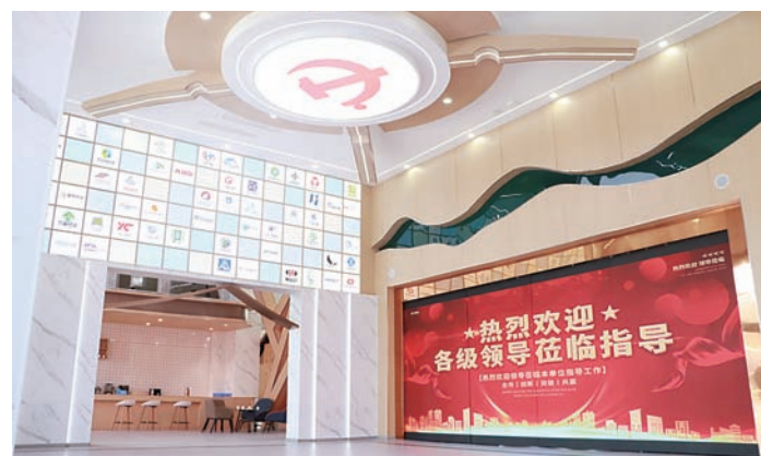
▲魏桥铝深加工产业园党群服务中心,打造了“红色引擎、时代劲铝”园区党建品牌。