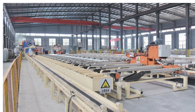
加快经济增长方式转变,推动镇域经济高质量发展。