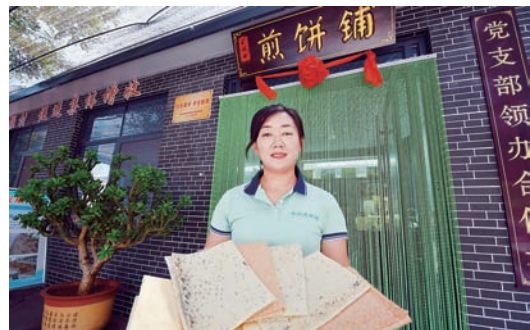
长山镇西北村以党支部领办合作社为依托,注册成立“西北煎饼铺”,深受群众喜爱。