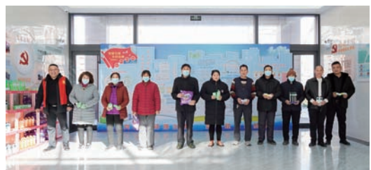
长山镇“积分宝”平台为村民进行积分兑换。