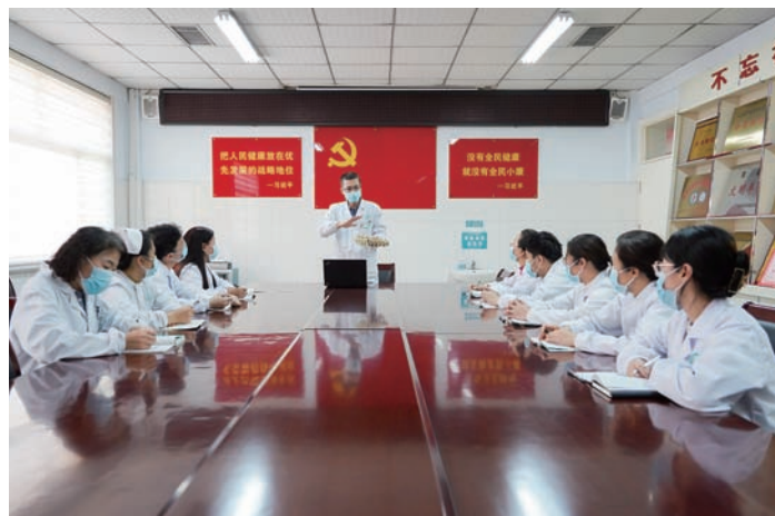
长山中心卫生院开展中医特色业务培训。