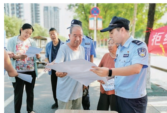
开展普法宣传活动,为平安和谐基层社会提供源源不断的法治动能和保障。