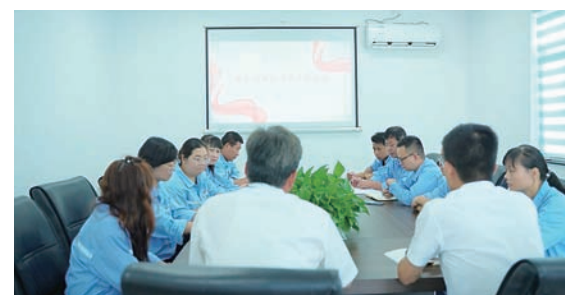
开展惠企政策宣讲进企业,打造良好的营商环境。