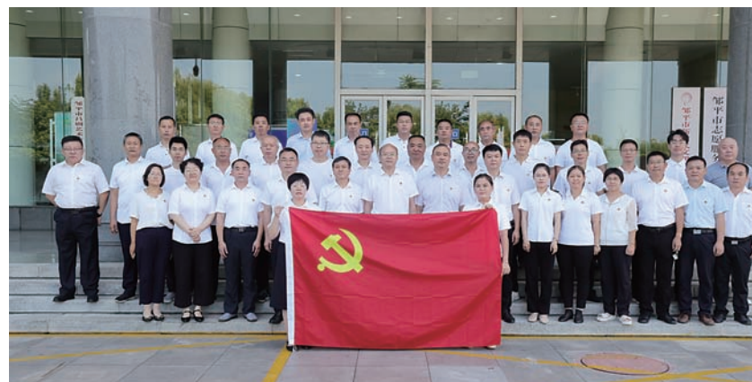
参观“学习贯彻党的二十大精神、奋发有为开新局”主题展览