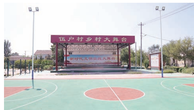
为移民村修建文化广场