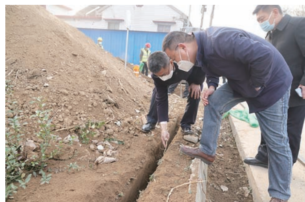
农村供水保障能力提升工程