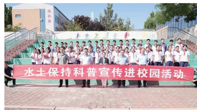
水土保持科普进校园