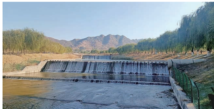
卧狼沟省级幸福美丽示范河湖