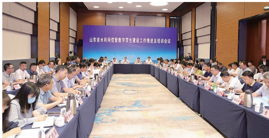
承办全省水利网信暨数字孪生建设工作推进及培训会

切实把准水利投资方向,认真吃透上级政策精神,密切加强与省市主管部门的衔接,瞄准闸坝除险加固、河道治理等项目,积极争取资金,合计发行地方政府专项债券资金2.9亿元,为加大水利项目建设,全面巩固夯实水利设施基础,补齐水利工程短板奠定了坚实的基础。数字水利工程正式运行,39座塘坝提升工程提前完成30座建设任务,新月河、白云河、黛溪湖综合治理工程按时完工,与小清河、杏花河、孝妇河等骨干河道互联互通,全市水网进一步完善,灾害防御能力进一步提升。