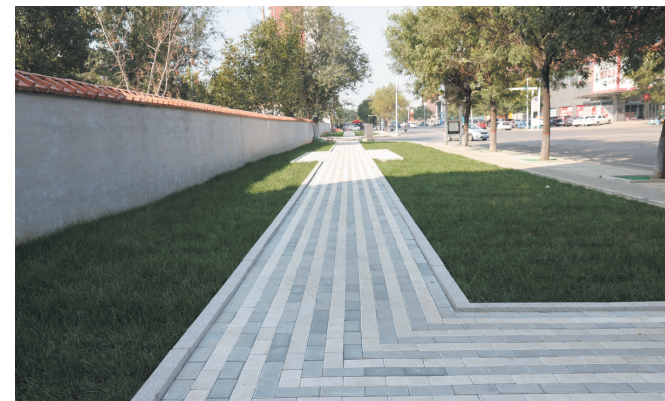
人行道改造提升工程。