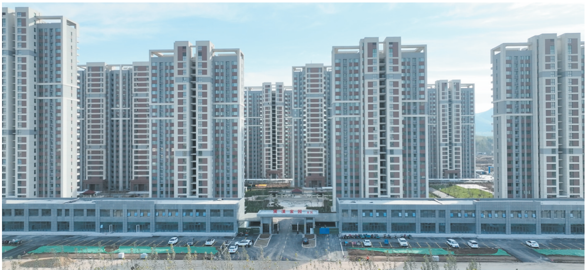
黛溪家园项目完工并完成分房工作。