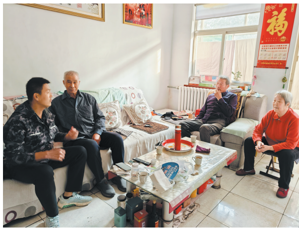
开展“暖心惠民”常态化走访工作。