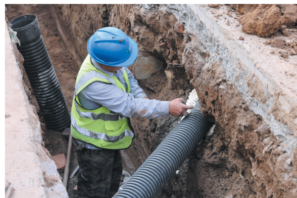
雨污管网升级改造工程。