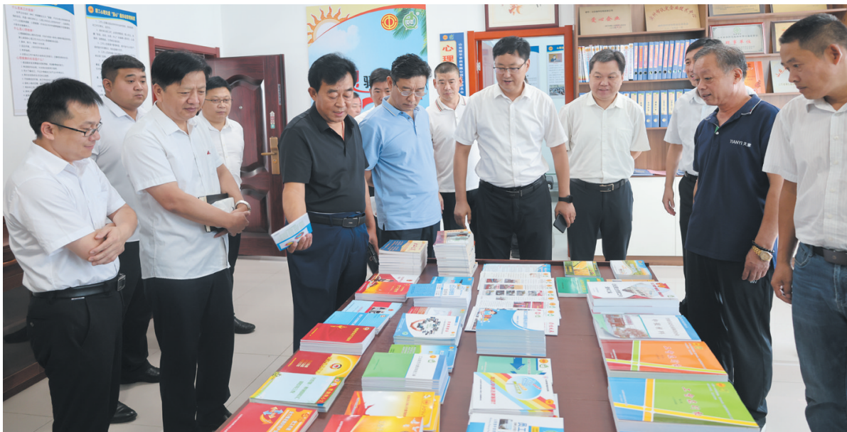
黛溪商会”开放合作,发展共赢“座谈会。