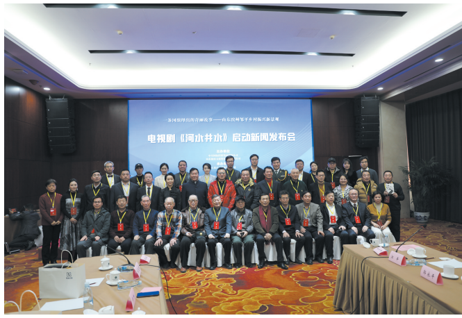
黛溪街道老西门文旅项目电视剧《河水井水》启动。