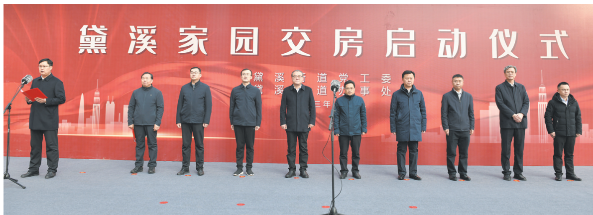
黛溪家园分房工作启动仪式。