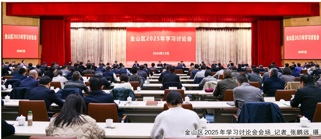
金山区2025年学习讨论会会场

刘健指出,明年是改革落实之年、承前启后之年、加速施工之年,要把握明年工作总体要求,一以贯之当好“施工队长”,全力以赴跑出“加速度”,为本届区委交出高质量履职答卷、为下一届区委良好开局起步奠定坚实基础。要正确把握当前发展,着眼更长周期和客观规律,全面辩证客观看待当前发展态势。要科学认识明年发展形势,抓住用好政策机遇,及时完善区级政策工具箱和项目储备库,更好夯实稳增长、促发展的政策支撑;要既正视困难、直面问题,又坚定信心、保持定力,紧抓机遇、乘势而上,全力推动经济社会发展持续回升向好。