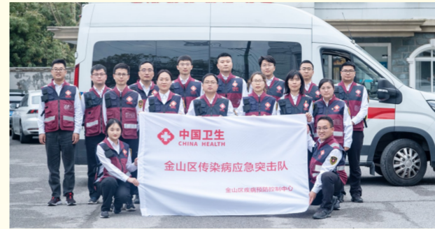
金山区传染病应急突击队

学科建设取得突破性进展。6个学科入选2024年度上海市卫生健康系统各类重点学科建设项目。2024年国家自然科学基金立项11项，其中金山区亭林医院立项1项，实现“零”的突破。