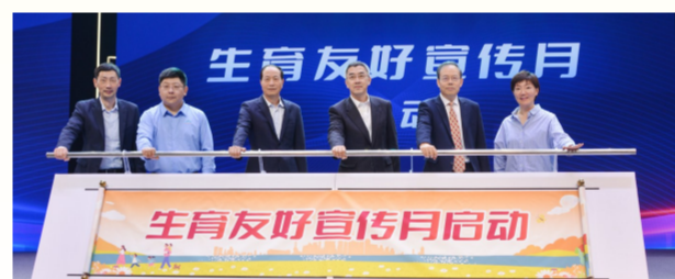
2024年“国际家庭日”主题宣传活动上海分会场在金山举行

强化全科医师队伍建设。通过开展“1+2+X”能力提升项目、推行全科医师积分制管理、邀请上级医院专家坐诊带教、全科医师进修学习等举措，不断提升全科医师诊疗能力。年内，3名全科医生、6家单位入选2024年度中国家庭健康守门人典型案例和入围案例。