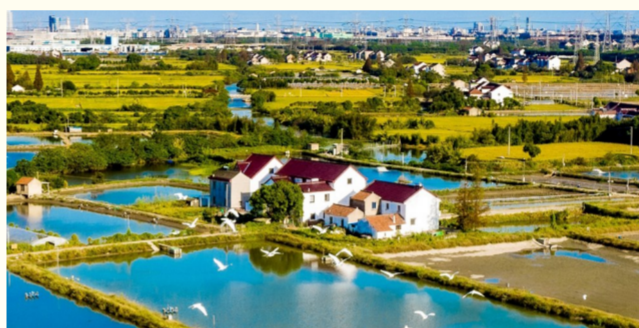
漕泾镇水库村生态清洁小流域工程助力健康金山获评第二轮健康上海行动优秀案例

便捷服务优化升级。拓展“高效办成一件事”服务内涵，在全市率先将晚血补剂预约、回国人员疟疾免费筛查等多项服务整合至“随申办”金山区旗舰店便捷应用模块，实现公共卫生服务事项“掌上办”，极大提升群众办事效率与满意度。