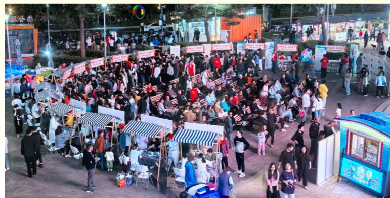
金山区中西医结合医院首场中医市集