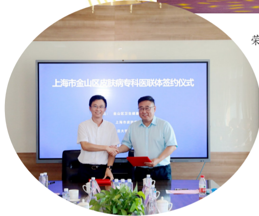
金山区卫健委皮肤科专科医联体签约