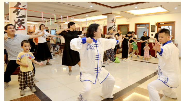
中医体验活动之八段锦