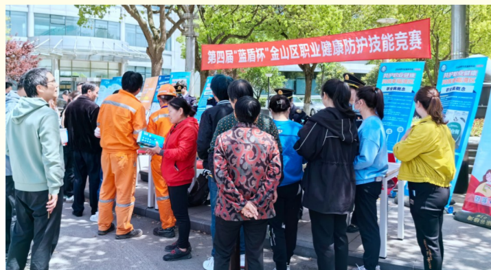
第四届“蓝盾杯”金山区职业健康防护技能竞赛

夯实基层卫生服务网底。枫泾镇社区卫生服务中心迁建项目竣工验收，山阳镇社区卫生服务中心新建工程稳步推进。优化社区卫生服务中心内“三中心一诊室”建设，新建1家市级示范性康复中心、3家护理中心、2家标准化口腔诊所，完成4家标准化村卫生室(社区卫生服务站)建设，辖区医疗服务环境进一步提升。