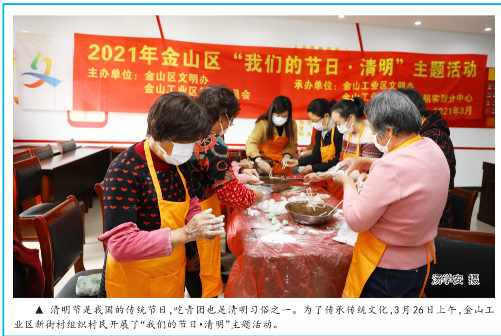
▲ 清明节是我国的传统节日,吃青团也是清明习俗之一。为了传承传统文化,3月26日上午,金山工业区新街村组织村民开展了“我们的节日·清明”主题活动。